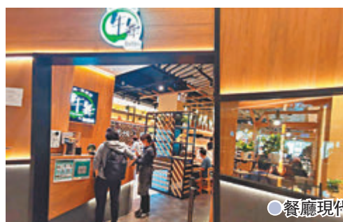
●餐廳現代日式裝潢空間感十足