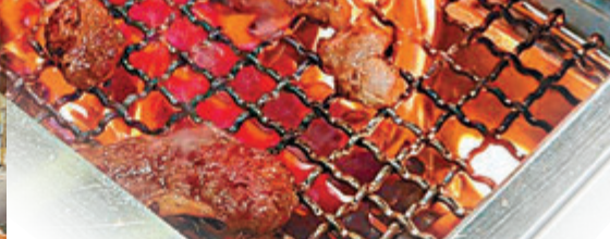
●牛舞拼盤：惠顧牛肉燒肉放題免費贈送。