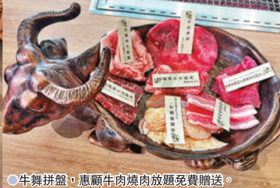
●鹿兒島著名薩摩牛