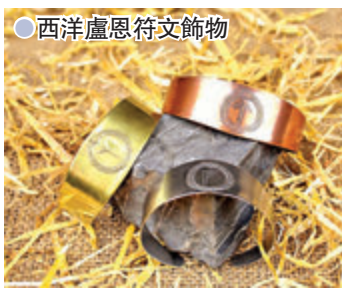
●西洋盧恩符文飾物

古代的北歐人過去經常將符文刻在一些生活實用的器具上，例如，農夫會將象徵豐收的「豐年」符文刻在農具上，戰士則將「雷神」刻在使用的兵器等。而流浪在其他國度的日耳曼民族，則是將符文刻在一些可隨身攜帶，如項鍊、戒指之類的裝飾品上。