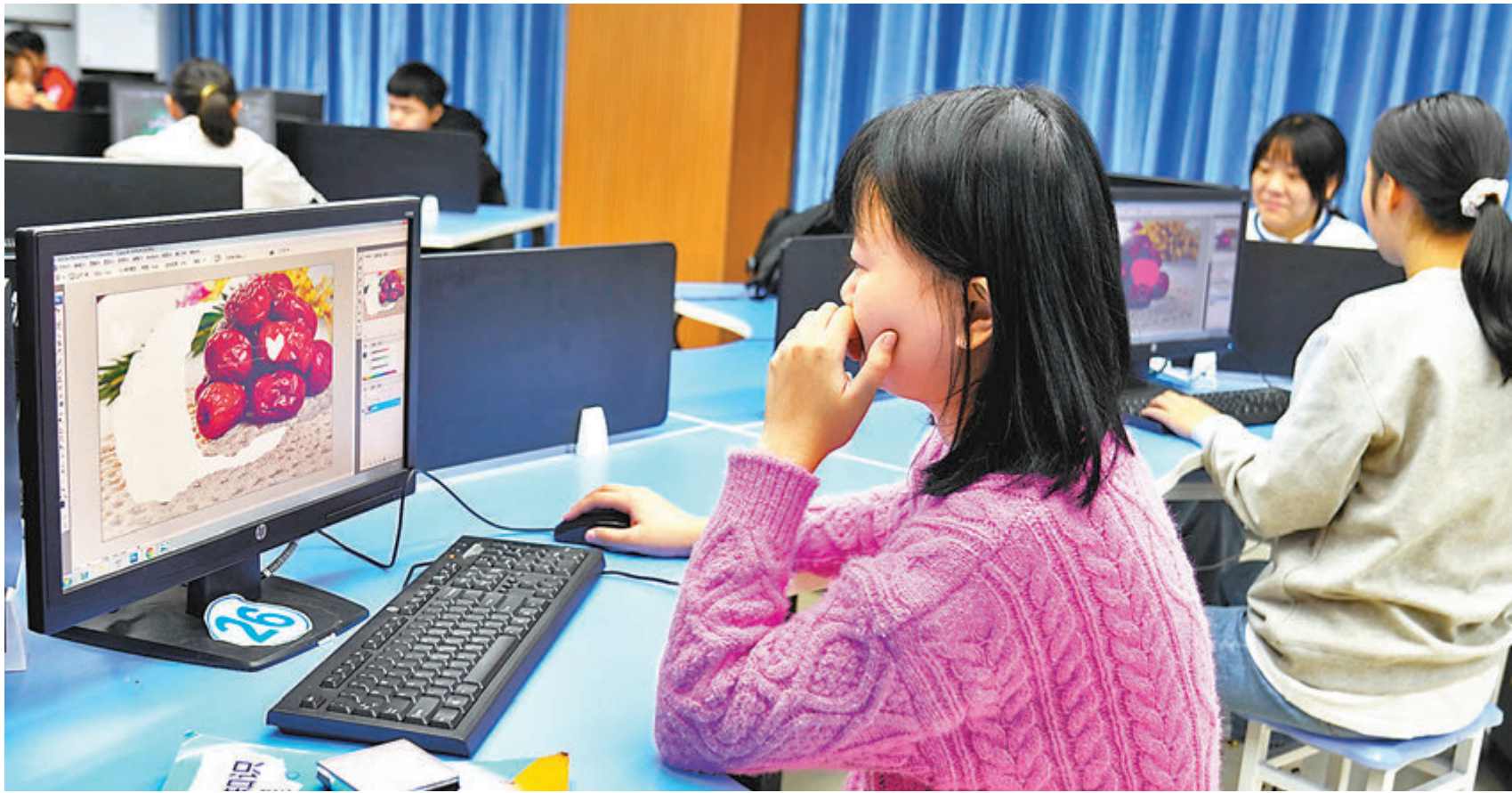
●習近平強調，中國平台經濟發展正處在關鍵時期，要着眼長遠、補齊短板、營造創新環境，推動平台經濟規範健康持續發展。圖為去年11月重慶市北碚區培訓電商技術人員，設置了包含網絡營銷、快遞物流、商品拍攝、直播帶貨、電商客服等方面的實訓。

香港文匯報訊 據新華社報道，中共中央總書記、國家主席、中央軍委主席、中央財經委員會主任習近平3月15日下午主持召開中央財經委員會第九次會議，研究促進平台經濟健康發展問題和實現碳達峰、碳中和的基本思路和主要舉措。習近平在會上發表重要講話強調，我國平台經濟發展正處在關鍵時期，要着眼長遠、兼顧當前，補齊短板、強化弱項，營造創新環境，解決突出矛盾和問題，推動平台經濟規範健康持續發展。中共中央政治局常委、國務院總理、中央財經委員會副主任李克強，中共中央政治局常委、中央書記處書記、中央財經委員會委員王滬寧，中共中央政治局常委、國務院副總理、中央財經委員會委員韓正出席會議。