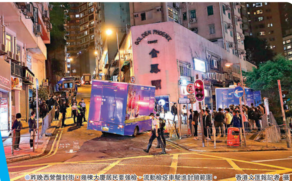
●昨晚西營盤封街，幾棟大廈居民要強檢。流動檢疫車駛進封鎖範圍。