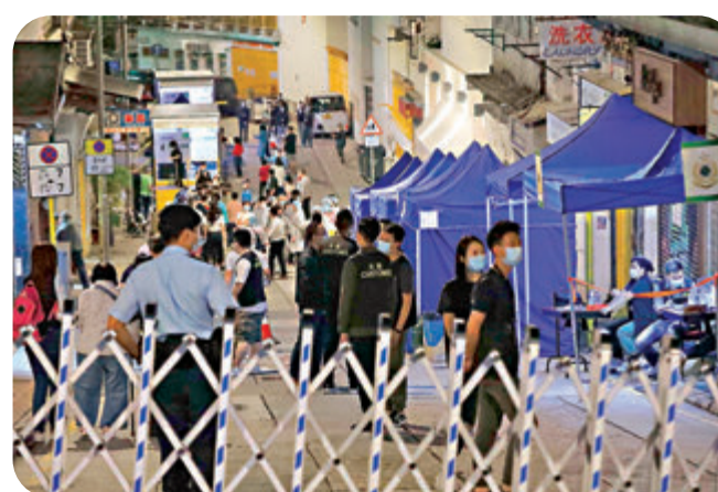
●警方拉起封鎖線禁止進入。

香港文匯報訊(記者 文森)西營盤健身中心URSUS FITNESS群組至今累計122人確診，成為本港自出現疫情至今第二大群組，患者主要居於中西區。特區政府昨日連續第三晚展開圍封行動，突擊圍封中西區及西營盤合共7幢大廈進行強檢，所有受限區域內人士須留在處所，直至區內所有人完成檢測方可離開處所。