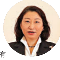
本地相關法例。她稍後會率領律政司全面配合政府的工作，希望盡早落實決定及修訂的基本法附件一及附件二以完善選舉制度，提升香港特區的治理效能，讓「一國兩制」行穩致遠，有效維護國家主權、安全和发展利益，繼續保持香港的繁榮和穩定。

律政司司長鄭若驊參與了昨日舉行的首場座談會，並參與其中一場由全國人大常委會法工委副主任張勇主持的座談會，與部分社會代表人士會面，聽取他們的意見。鄭若驊表示，十分感謝中央在短時間內迅速安排座談活動，積極收集香港各界意見，充分考慮香港的實際情況來完善選舉制度。鄭指出，全國人大常委會即將會依法修改基本法附件一及附件二，繼而香港特區亦會修改