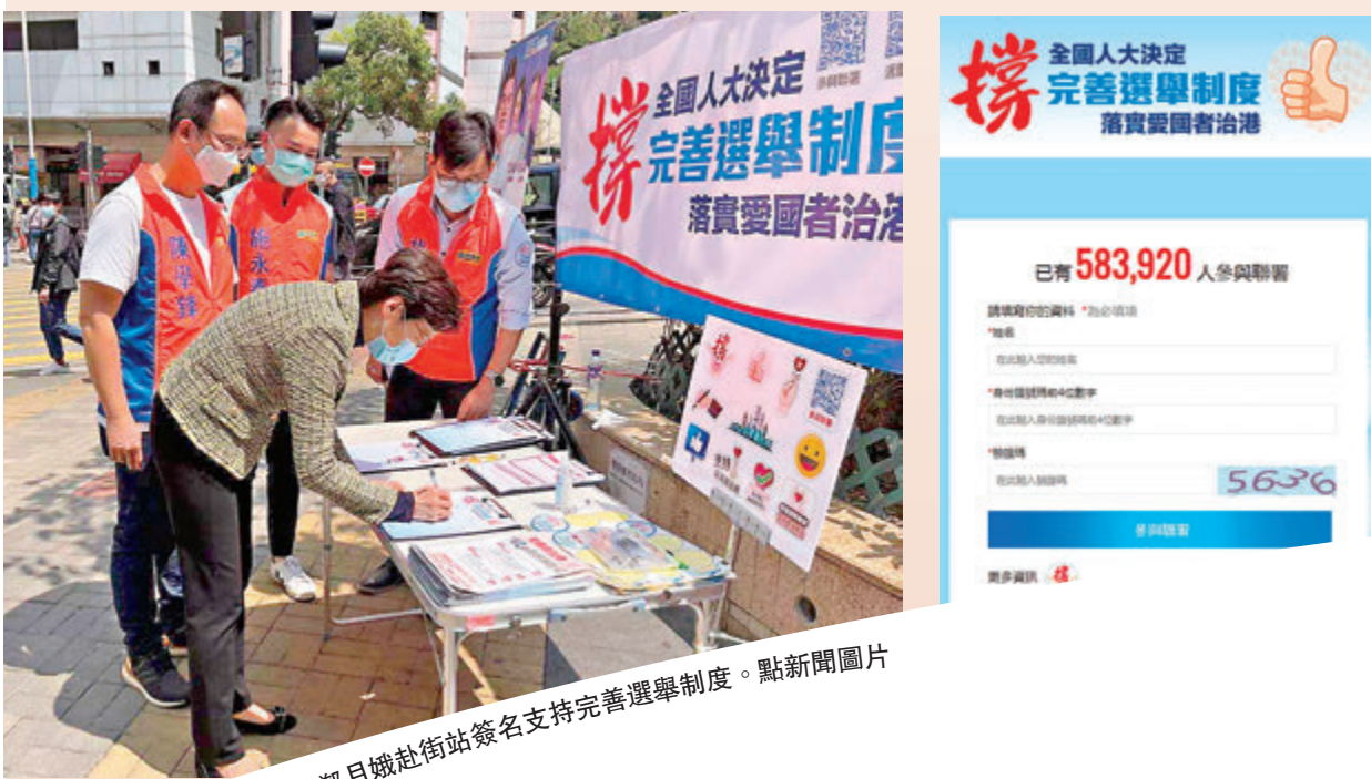
林鄭月娥街站簽名支持完善選舉制度。