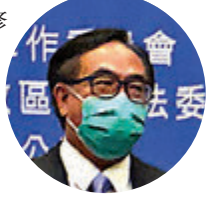
他認為，現時涉及區議會的6個立法會議席，及區議會在選委會內的117個席位都應全部取消，因為不少現屆區議員曾煽動他人參與黑暴及聯署反對香港國安法，已經超出區議會作為地區諮詢架構的職能，因此他們不應具備選出行政長官的資格。

他說，在全國人大常委會完全修訂香港基本法附件一和附件二後，香港接下來須開展本地立法工作，經民聯會就完善香港特區選舉制度繼續吸納專業人士的意見。