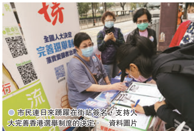
市民連日來踴躍在街站簽名支持人大完善香港選舉制度的決定。

張勇在會議上表示，法律是一種社會關係的調節器，「所以我們制定法律，你可能希望50分，他可能希望100分，還有人希望60分或70分，我要聽不同的意見，但最後的落腳點，我可能是落到80分上去」，「你們感覺『行，80分我接受了』可以來遵守這部法律就是最好的法律。」張勇表示，立法和修改法律後，從事立法工作的人的心態就是希望達到方方面面都能接受的狀態，所以他把昨日座談會的主要時間交給大家，讓大家充分清晰地表達意見。