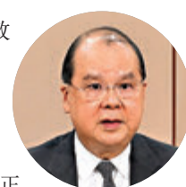
他強調，決定修補了香港選舉制度漏洞和缺陷，是合憲合法、合理正當的，是從制度上全面貫徹落實「愛國者治港」原則，確保中央對香港的全面管治權，有效維護香港特區政治穩定及政權安全，充分考慮香港的實際情況，從香港整體利益出發，讓香港重回「一國兩制」的初心和正軌。

政務司司長張建宗昨日參與了由國務院港澳事務辦公室常務副主任張曉明主持的座談會。他其後在網誌中表示，他在會上表達對全國人大有關決定的堅定支持，並強調特區政府會全力配合完善香港選舉制度的工作，全面開展宣傳解讀工作，力爭早日完成本地立法，並確保未來12個月的各場重要選舉有序順利舉行。對於社會上流傳的不實言論，特區政府亦要及時澄清謠言、釐清事實、以正視聽。