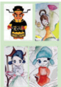
●小學生繪寫歷史人物。

人生許多事情複雜，禍福常變，好壞俱有，壞事如何能變好事？ 所謂「禍兮福所倚，福兮禍所伏」。事情好壞難料，常出現逆轉、變動，讀《淮南子》「塞翁失馬」的成語，就悟到禍福同門，好事不一定全好，壞事不一定全壞，也能變成好事！雖受到一時損失，也許反而因此能得到好處。疫情宅家，無法過以前般自由出入之生活；疫情學習，無法像以前般自由面授及群體討論，但多了個人空間。宅家留下讀書時光，沉思內省，寫作增值；更能親視家人，強身健心。我們要正視壞事（疫情），正確對待——重視抗疫，從中吸取經驗、教訓；要用艱苦奮鬥精神實幹，戰勝壞事所帶來的困境、難關，挽回壞事造成的損失。 疫情持續嚴峻，莘莘學子要網上電子學習，要讓青少年戰勝疫情日常宅家這表面是壞事所帶來的困難；我推薦大家親親「悅讀」，寫作為樂，讓孩子在疫情中學習自主，燃亮孩子對學習的熱誠和興趣，向更高的目標努力！ 勵進教育中心同齡同心學歷史計劃，今年再為小學生舉辦「2021閱讀悅高學歷史，穿梭時空來創作」徵文賽，旨在推動青少年加深對中國歷史的興趣及認知，鼓勵小學生熱衷了解、學習中國歷史，培養他們通過閱讀自主學習，提升寫作能力。 徵文賽期盼青少年多讀中國歷史書，可從閱讀成語中，學會一些中國歷史事件，如火燒連環船、荊軻刺秦王、圖窮匕現、望梅止渴等，從而知道相關的歷史及人物如孔明、曹操等；青少年可通過讀史來自省、自我提問，代入中國歷史人物的領域，體現人物心情、經歷，下筆反思；藉着讀寫結合，樂於提筆，勾勒要點發揮，揮筆寫出自己的感悟、對人物之看法，電子投稿參賽，宅家創作從「悅讀」中得益，仍活出充實快樂的好時光。 在香港土生土長的青少年，平日較少接觸中國歷史，今年舉行此徵文比賽，可鼓勵小學生多閱讀、多思考、多寫作，在對中國歷史人物的加多認知後，在寫作、「悅讀」旅程中穿梭時空，和古人心靈溝通，見賢思齊，潛移默化中不少傑出人物的事跡和品德情操借鏡；成長後尋找自我價值，對社會有所貢獻，意義殊深，值得支持。（詳情瀏覽香港教育城及中外文化推廣協會網站：https://hkispc.blogspot.com）