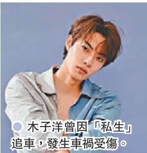
●木子洋曾因「私生」追車,發生車禍受傷。

追車,讓他無奈發文「別再私下追車了好嗎?」;鹿晗為歌曲《敢》作詞,歌詞中流露出他長期因為粉絲跟車而感到困擾的心聲,甚至也曾和跟車的司機對罵,但問題其實一直沒有得到改善,相當無奈。