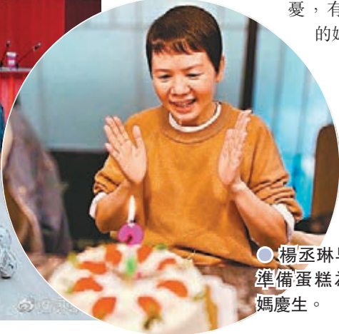
●楊丞琳早前準備蛋糕為媽媽慶生。