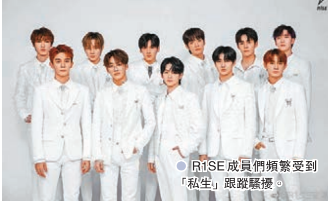
●R1SE成員們頻繁受到「私生」跟蹤騷擾。