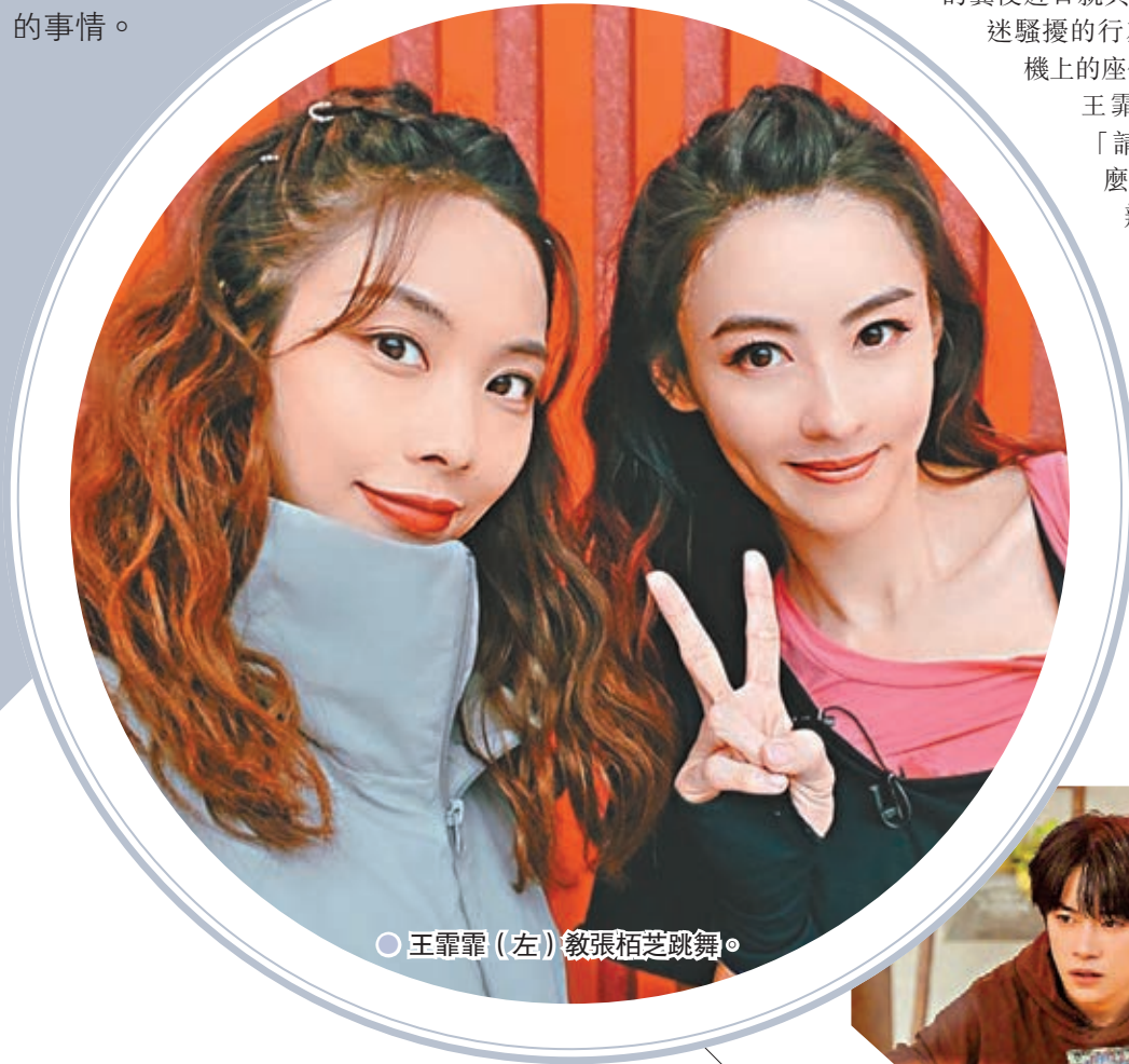
○王霏霏(左)教張栢芝跳舞。

香港文匯報訊(記者凡文)藝人獲得粉絲們關注本是好事,但有狂熱者為了私慾干擾明星生活,卻對藝人們造成極大困擾。科技發達更讓狂迷的騷擾事件層出不窮,不止窺探偶像行蹤,連私生活也不放過緊貼追隨,現在甚至連偶像的飛機座位也能隨意調配,安排對方坐到自己旁邊,做法愈見喪心病狂。保障藝人隱私及自身安全,恐怕是亟待解決的事情。