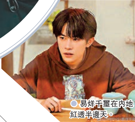
●易烱千璽在內地紅透半邊天。

內地男團R1SE成員頻繁受到「私生」跟蹤騷擾,包括多次撥打電話、多次按門鈴,甚至有成員被激光筆照射眼部。上月,R1SE官方微博發表聲明,表明已積極取證追究法律責任:「R1SE成員在休息及活動期間,個別人員依然通過違規行為獲取藝人相關信息,多次對藝人進行電話、敲門按鈴、違法錄音等騷擾行為,更有人使用激光筆照射成員眼睛,對藝人的身心造成極大傷害。對此,官博做出鄭重聲明:堅決抵制販賣私人信息等涉嫌違法的行為!對於個別執迷不悟之人,我司已積極取證,依法追究法律責任。」官博的聲明得到了不少網友的支持:「好好保護成員們!」、「報警吧,堅決抵制!」