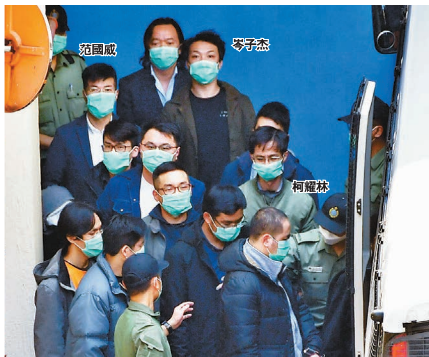
●部分前「民陣」骨幹成員涉嫌違反香港國安法還押候審。圖為多名被告早前由囚車押送至法院應訊。資料圖片