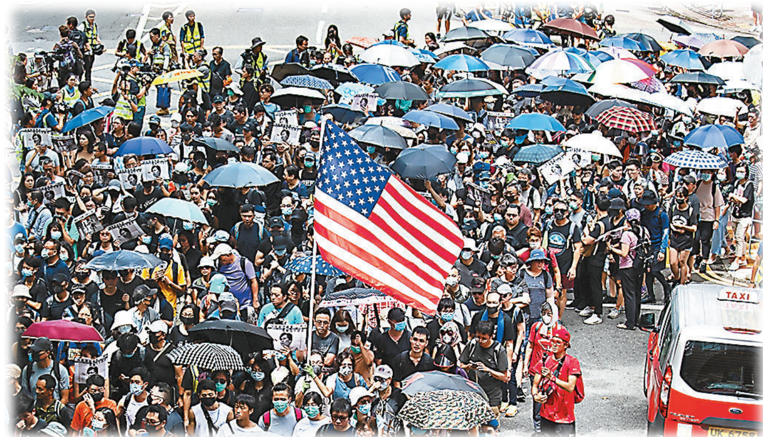
●新加坡媒體早前引述消息指，港府正調查「民陣」有否接受美國國家民主基金會資助，在修例風波期間舉辦遊行。圖為前年「民陣」發起的非法遊行。