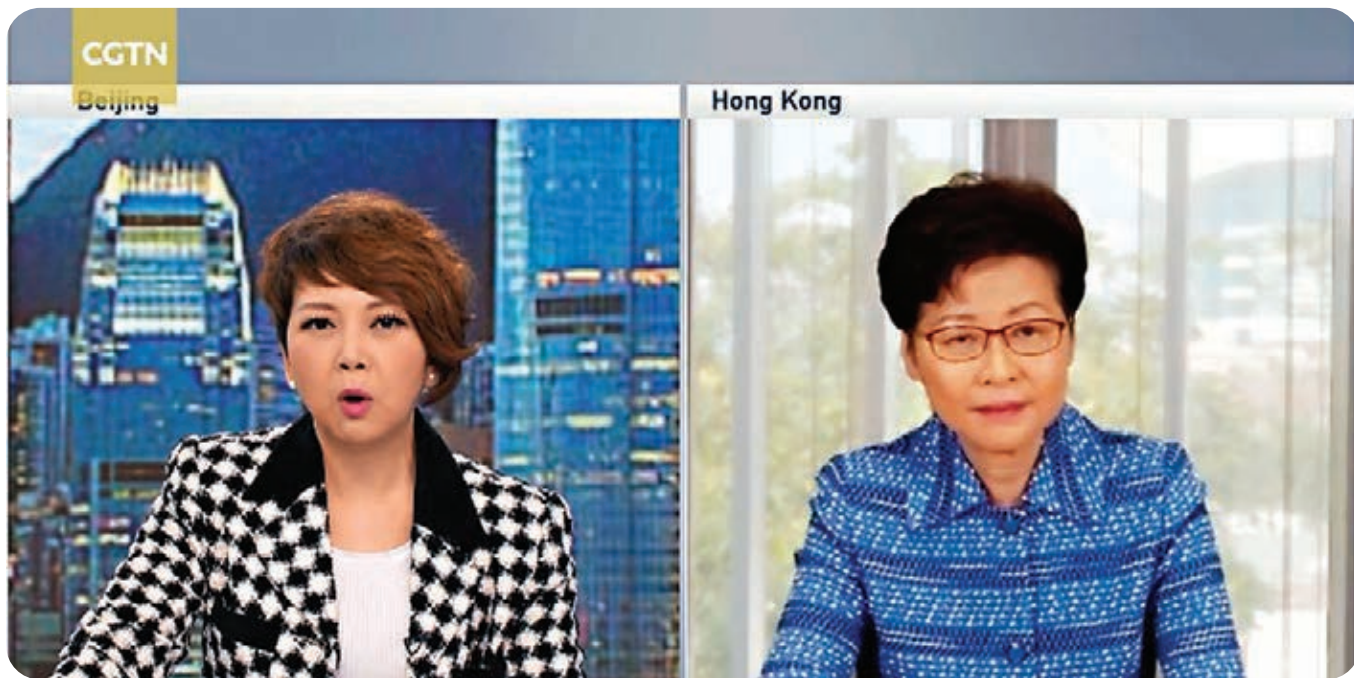
林鄭月娥 (右) 接受 CGTN 訪問時指出，完善選舉制度不會損害香港的權利和自由，而時間將會證明一切。