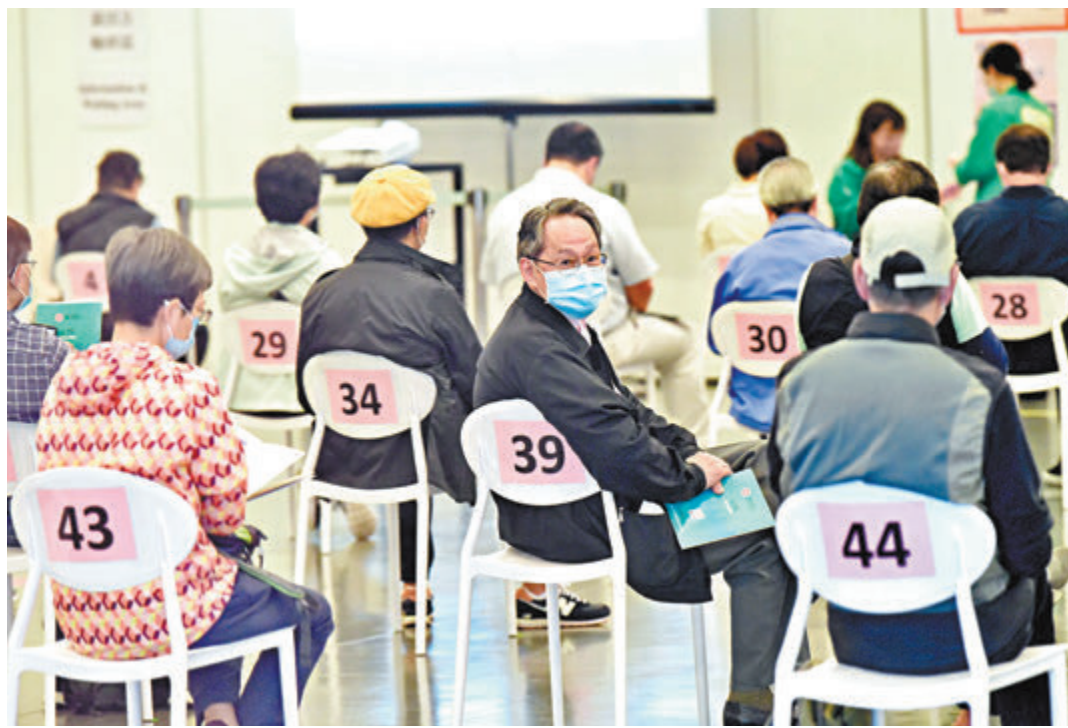
●新冠肺炎疫苗接種計劃展開約三星期，截至本週日已有9.3萬人接種其中一款疫苗。 中新社