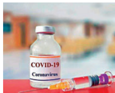
●多個歐洲國家先後停用阿斯利康疫苗。

香港文匯報訊(記者 文森)香港早前預購英國阿斯利康新冠疫苗預料於今年下半年供港。近日，世界各地連接有人接種該疫苗後出現血栓，歐洲多國及泰國因此決定暫停接種該疫苗。香港衛生署昨日表示，正向藥廠索取更多資料，密切監察疫苗品質是否符合當局標準。