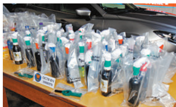
●前年10月20日警方在拘捕的士司機時檢獲約40支汽油彈等證物。 資料圖片

被告稱，由於教育大學算是知名地方，有保安員和閉路電視，他亦一直與熟客透過電話溝通，故沒懷疑