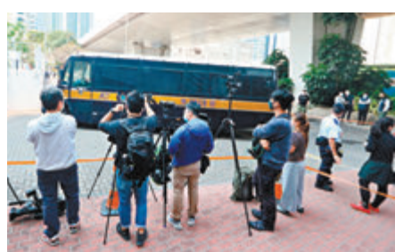
●21名顛覆罪被告昨日由囚車押往法院。 香港文匯報記者攝

香港文匯報訊(記者 葛婷)47名發起或參與去年「35+初選」被控串謀顛覆國家政權的攪炒政棍，上週提訊時有31人被國安法指定法官、總裁判官蘇惠德拒絕保釋申請，其中的21名被告昨在西九龍裁判法院申請保釋覆核，並繼續由蘇官處理。蘇官聽畢陳詞後，認為沒有重大環境改變足以改變他早前的決定，拒絕岑子杰、岑啟暉、毛孟靜、吳敏兒等11人的申請；而區諾軒、黃之鋒等10人則放棄保釋申請，21人須繼續還押。