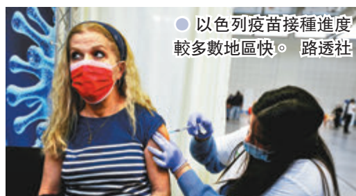
●以色列疫苗接種進度較多數地區快。 路透社

美國輝瑞藥廠尚未公布兒童對新冠疫苗的測試結果，但以色列衛生部早前已建議為有健康問題的兒童打針，目前已有數百名12歲至16歲兒童接種輝瑞/BioNTech疫苗，沒有出現嚴重副作用個案，初步認為疫苗對兒童安全。