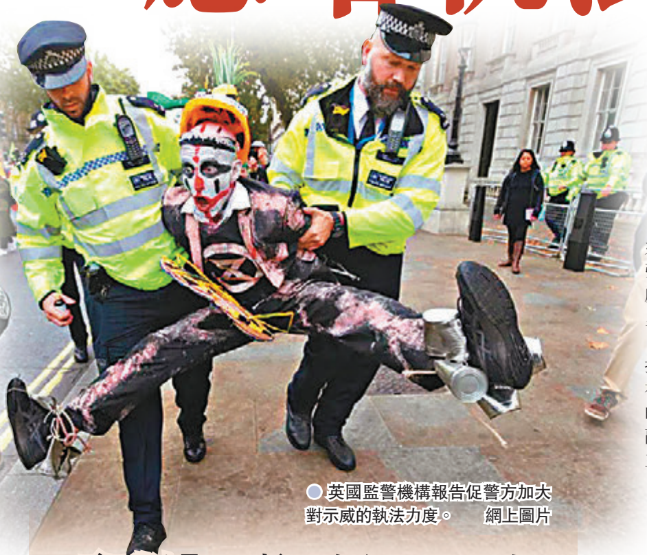
●英國監督機構報告促警方加大對示威的執法力度。