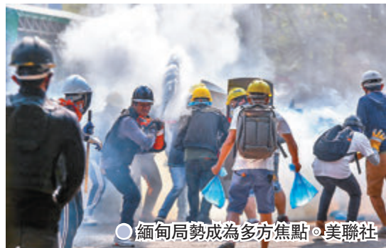
●緬甸局勢成為多方焦點。

聯合國安理會前日就緬甸局勢發表主席聲明，強烈譴責緬甸軍方針對和平示威者的暴力，並再次呼籲釋放國務資政昂山素姬等人，是安理會自緬軍接管政權後，第二次就緬甸局勢表達立場。緬甸昨日的示威據報再有多名示威者被殺，軍方同日則再加控昂山一項非法接受金錢罪，指她涉嫌非法收取60萬美元（約465.5萬港元）及11.2公斤黃金。