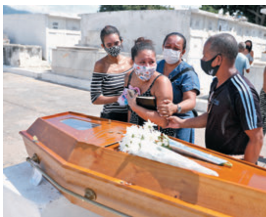
●巴西多人疫歿，有親屬在喪禮上痛哭。