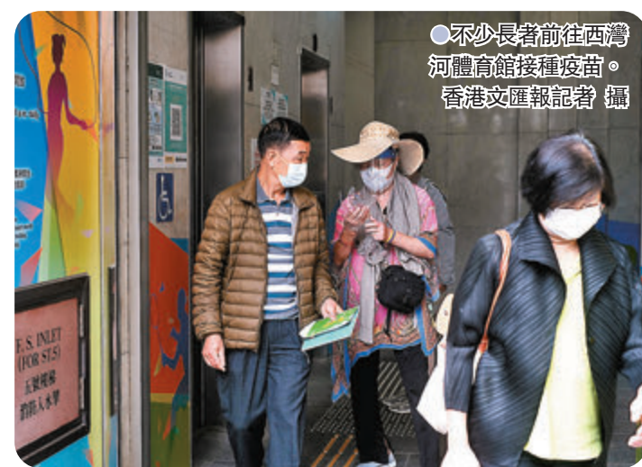
不少長者前往西灣河體育館接種疫苗。

醫管局昨日向衛生署呈報接種疫苗後異常事件，一名本身患有高血壓及退化性膝關節炎的70歲老婦，昨日早上出現氣喘，中午在家中暈倒，送往廣華醫院搶救無效死亡。