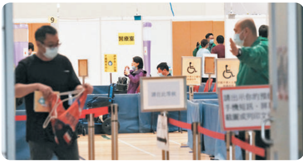
觀塘曉光街體育館內，市民接受疫苗注射後即場休息30分鐘，觀察有否異常反應。

附註五： 在《規例》下，衛生主任無委任便可執行關於強制檢測公告下的規定的職能。 2021年3月10日 食物及衛生局局長