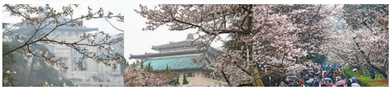
● 在武漢大學拍攝的櫻花