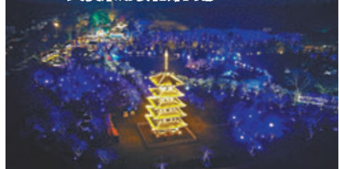
● 2021武漢東湖櫻花節開幕