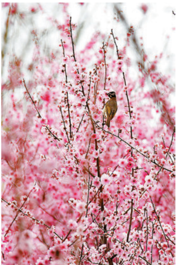
● 一隻小鳥在美人梅枝頭棲息。

棲息，一片和諧。位於河南省南陽市中心城區仲景路、濱河路、中州路及城市支路相圍合的區域的梅城公園，目前也是梅花綻放，遊客駐足觀賞。梅城公園分為「梅城遺韻區」和「曲藝健身區」兩部分，是一個以展現歷史文化、體育文化為主題，集生態、休閒、健身、娛樂為一體的綜合性公園。