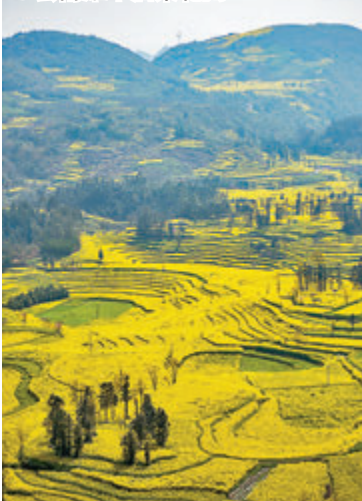
● 雲南羅平油菜花開