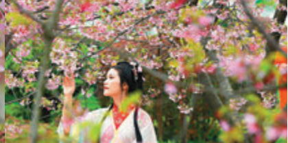
● 遊客身着漢服在武漢東湖櫻花園內賞花留影