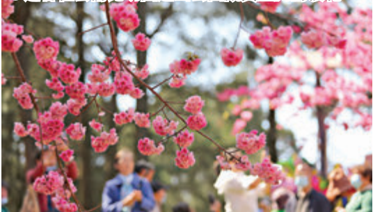
● 遊客在雲南昆明圓通山公園觀賞盛開的櫻花

花、日本櫻花和垂絲海棠競相開放，紅白相映，燦若霞海，落英繽紛，恍若仙境。昆明市民有這樣的說法：「賞櫻花根本不必到日本，到圓通山就行。」