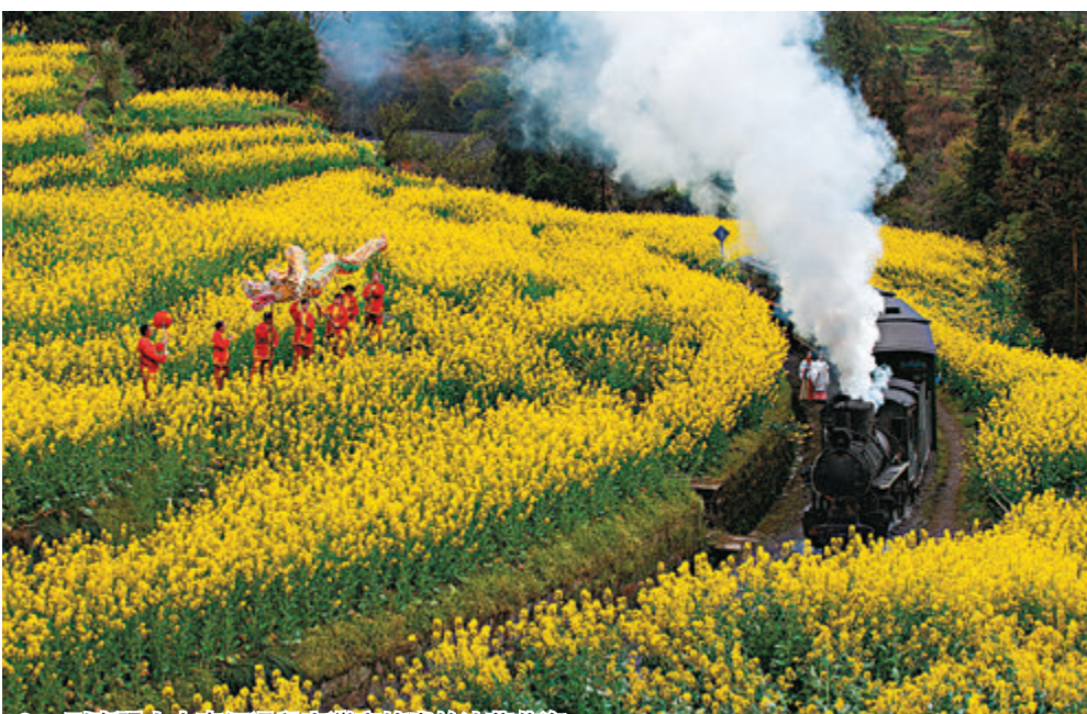
● 一列嘉陽小火車經過段家灣蜜蜂岩的油菜花海。

四川省犍為縣的嘉陽小火車旅遊迎來旺季，眾多遊客慕名前來乘坐這列開往春天的「小火車」，沿途觀賞風景，體驗老式窄軌蒸汽火車的獨特魅力，隨小火車穿過段家灣蜜蜂岩的油菜花海。而在其鄰省，雲南省曲靖市羅平縣的油菜花亦相繼開放，景色秀美，蜜蜂更在盛開的油菜花旁飛舞，非常熱鬧。