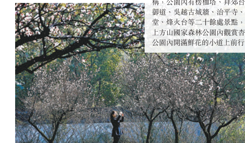
● 遊客在蘇州上方山國家森林公園內觀賞杏花

位於蘇州市南部石湖湖畔的蘇州上方山國家森林公園，以吳越遺蹟和江南水鄉風光而著稱，公園內有楞伽塔、拜郊台、越公井、乾隆御道、吳越古城牆、治平寺、茶磨嶼、石湖草堂、烽火台等二十餘處景點，日前不少遊客在上方山國家森林公園內觀賞杏花，觀光車亦在公園內開滿鮮花的小道上前行。