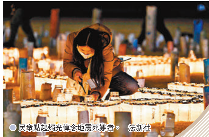
●民眾點起燭光悼念地震死難者。