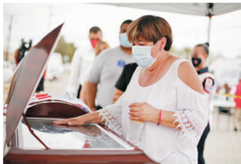
●墨西哥一名母親與生前當醫生的兒子陰陽永隔。

墨西哥的新冠肺炎疫情嚴峻，累計確診病例超過213萬宗，居全球第13，死亡個案更高達逾19萬宗，居全球第3，僅次於美國和巴西。墨西哥總統奧布拉多爾今年1月已與美國總統拜登通電話，要求美國提供更多疫苗，但不得要領，墨西哥決定向中國尋求協助，外長埃布拉德前日宣布，已向中國增購2,200萬劑疫苗，連同之前的訂單，合共向中國採購3,600萬劑，冀能加快為國民接種，盡早遏制疫情。