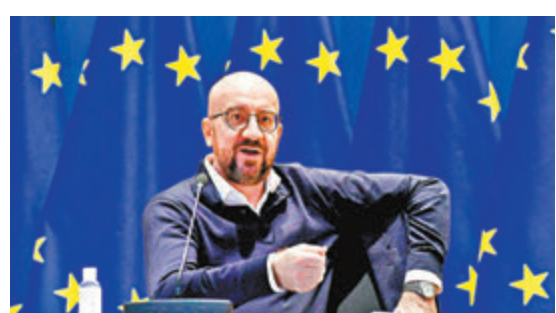
●米歇爾否認歐盟奉行「疫苗民族主義」。