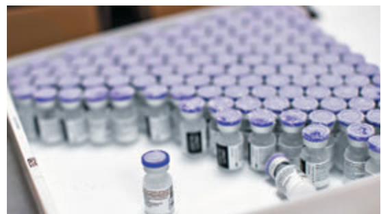
●歐盟疫苗接種率遠低於英美。美聯社

似不實指控，英國已傳召歐盟駐英國代表提出抗議。米歇爾前晚在社交網發文，表示若英國保證疫苗出口「公開透明」，增加向歐盟和發展中國家的疫苗出口量，他會感到高興。 ●路透社/法新社