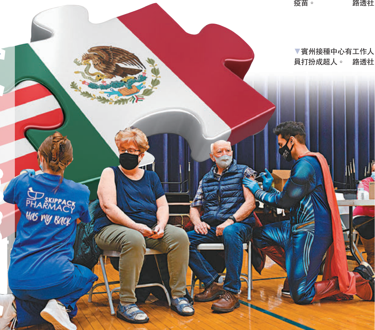
▲醫護準備協助民眾接種疫苗。