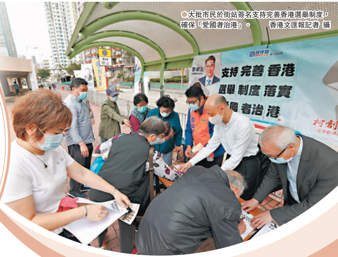
●大批市民於街站簽名支持完善香港選舉制度，確保「愛國者治港」。