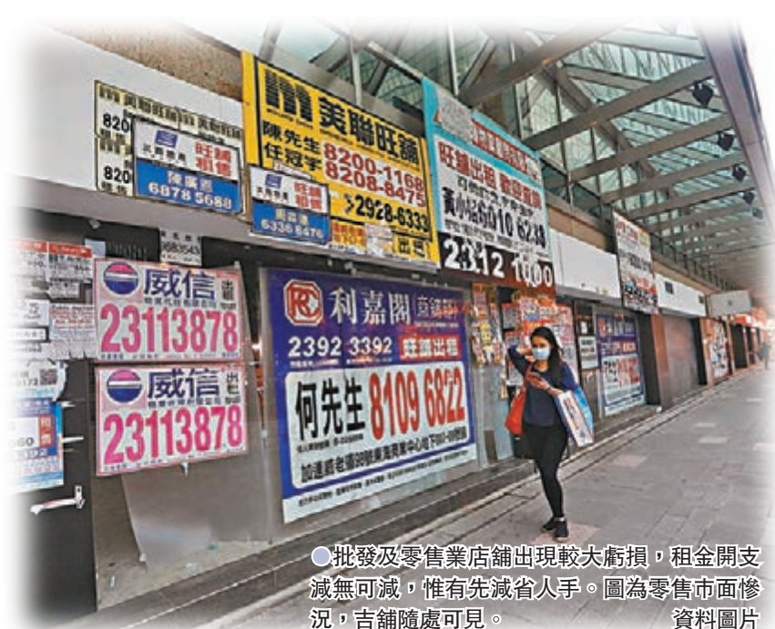
批發及零售業店舖出現較大虧損，租金開支減無可減，惟有先減省人手。圖為零售市面慘況，吉舖隨處可見。