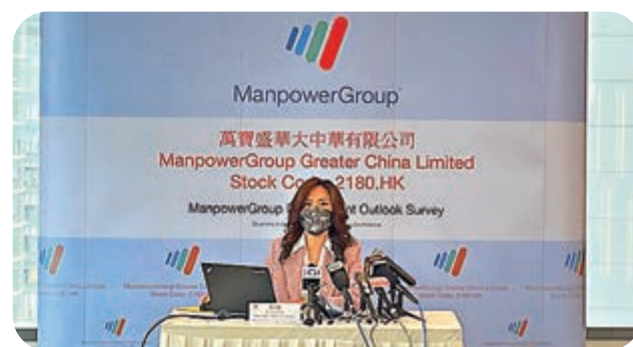
人力資源顧問公司一項調查顯示，香港的就業展望指數是亞太區中最疲弱。