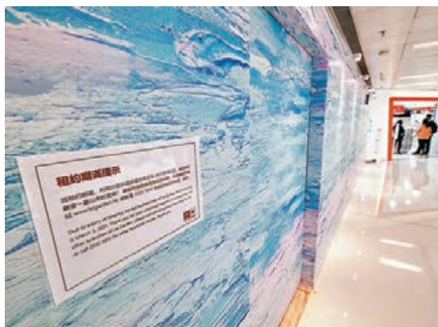
●開業37年的利苑沙田分店租約期滿結業。

工聯會飲食業職工總會名譽會長郭宏興指出，目前食肆面對的最大問題是4人「限聚令」導致沒法做春茗生意，「去年疫情期間曾一度放寬至可6人一枱，這也可做半圍（酒席），故現時的情況對主力做宴會的酒樓構成很大壓力。」他指出，部分飲食集團在租約期滿後關閉分