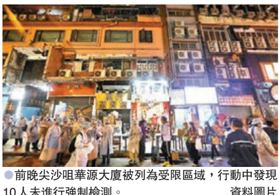
●前晚尖沙咀華源大廈被列為受限區域，行動中發現10人未進行強制檢測。資料圖片

一批身穿保護衣的人員為大廈居民登記，居民出示陰性檢測結果短訊或佩戴手環證明才可離開。大廈封鎖期間，當局派員到訪約520戶，包括30多間賓館的約180個房間，當中約260戶或房間，包括約100個賓館房間沒人應門。政府人員其後再次到訪，經調查後初步相信其中約25戶或房間是空置單位，另外有約53戶或房間的住戶稍後亦已應門，並能證明已接受強制檢測。行動最終發現10人未