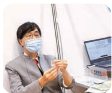
●政府專家顧問袁國勇自打「復必泰」疫苗。資料圖片

衛生署昨日公布，接獲醫管局呈報一宗涉及接種新冠疫苗後出現嚴重異常的事件，涉及一名患有糖尿病、高血壓和高血脂症的51歲男子。他曾於本月3日在源禾路體育館社區疫苗接種中心接種一劑科興新冠疫苗，在本月6日感到氣促、咳嗽和有痰，前天於伊利沙伯醫院急症室求醫，需要住院，初步診斷為急性心肌梗塞，前晚轉往深切治療部作進一步治療，現時情況危殆。