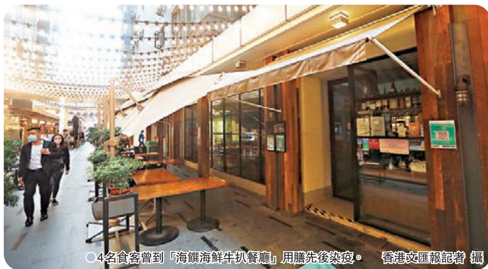
●4名食客曾到「海饌海鮮牛扒餐廳」用膳先後染疫。

中心調查發現，連同這宗個案，海饌餐廳已有3枱共4名食客確診，全部也是於上月22日中午12時至下午3時期間到該餐廳午膳，其中一名51歲男食客更曾於上月19日到