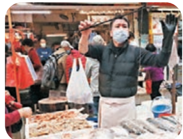
●街市檔販群組等較難提供證明，政府會寬鬆處理、方便市民。圖為北角春秋街街市一魚檔。資料圖片

香港文匯報訊（記者 成祖明）特區政府早前宣布，新增街市檔販等7個組別為優先疫苗接種群組。公務員事務局局長聶德權表示，昨日收到不少業界、議員及市民的意見回饋指，街市檔販群組等較難提供證明，他表示政府會寬鬆處理、方便市民，食環署轄下的街市攤檔承租人可用拾位證等作身份證明。