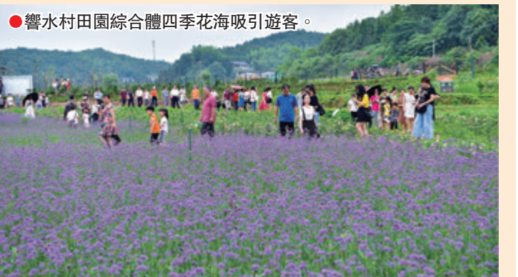
●響水村田園綜合體四季花海吸引遊客。

為真正破解鄉村難題，探索鄉村振興「天元模式」，天元區借鑒工業園區的發展經驗，今年1月，石三門現代農業公園管委會正式掛牌，這在全省範圍內又是一項創舉。