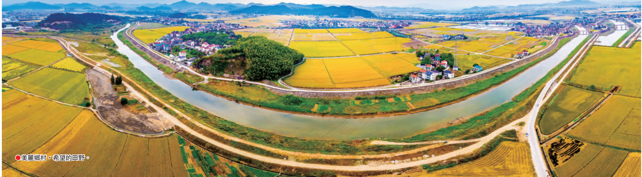
●美麗鄉村，希望的田野。