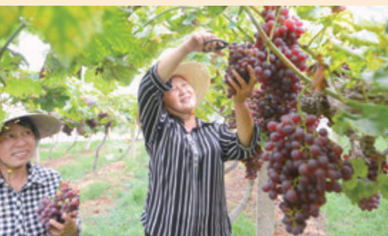
●農業莊園裏的工作人員在採摘葡萄。

花海、果林、鴻雁公園、房車營地……共同營造了一處休閒度假的樂園，這就是歷時三年建成的株洲市天元區響水村國家級田園綜合體。