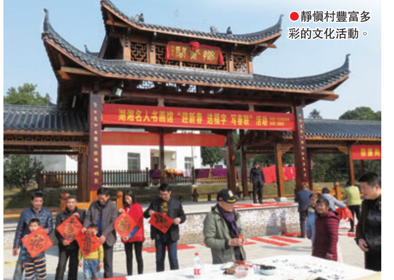
●靜慎村豐富多彩的文化活動。

目前，靜慎村年人均收入突破3萬元，家家有存款，戶戶有汽車，60%的家庭還在城裏購置了房產。