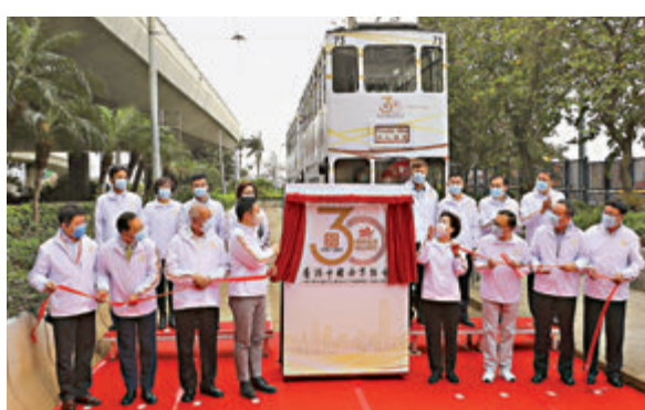
●民政事務局長徐英偉（前排左四）、中聯辦副主任仇鴻（前排右四）、中企協名譽會長沈曉初（前排右三）為中企協30周年會慶紀念徽標主持了揭幕發布儀式。

徐英偉稱讚中企協致力促進香港工商發展，大力推動香港、內地與各國之間的經貿往來，是香港與各地連繫的重要橋樑。此外，中企協積極維護「一國兩制」，支持特區政府依法施政，保持社會繁榮穩定，建樹良多。他亦對中企協積極參與各類慈善活動和資助香港學生參與實習、交流等表示肯定，讚揚其主動履行企業社會責任，惠及社會大眾。