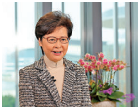
●林鄭月娥為國際婦女節拍攝祝賀短片。

林鄭月娥昨日亦與勞工及福利局局長羅致光、婦女事務委員會主席陳婉嫻在2021年國際婦女節慶祝短片致辭。她說，新冠肺炎在全球肆虐，聯合國婦女署特別將今年國際婦女節的主題，定為女性領袖在抗疫中達至平等的未來。她表示，