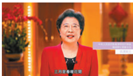
●仇鴻在香港婦協於網上舉行的「香港各界婦女慶祝三八婦女節」拍攝祝賀短片。視頻截圖

香港文匯報訊 昨日是國際婦女節，中聯辦副主任仇鴻代表中聯辦向香港各界婦女姐妹，致以節日問候和良好祝願。