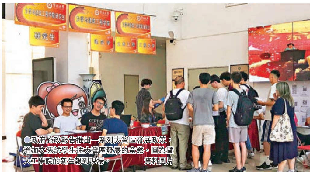
●政府施政報告推出一系列大灣區發展政策，增加文憑試學生往大灣區發展的意慾。圖為暨大工學院的新生報到現場。