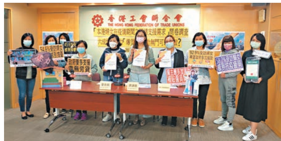
●工聯會婦女事務委員會促請政府關注本港婦女因疫情造成的情緒問題，提供協助。

她特別提到，去年底發生一宗家庭倫常慘劇，一名母親為全職在家照顧3名幼子女而辭掉工作，惟最後疑因不堪照顧家