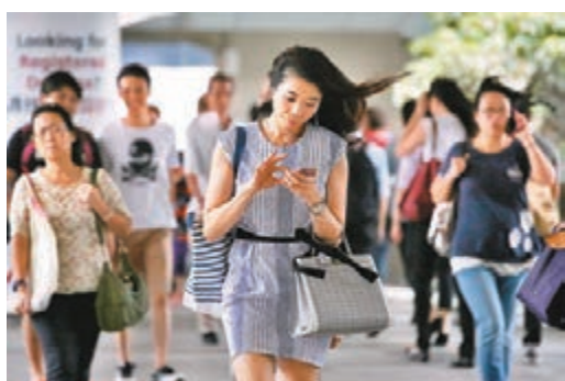
●愈來愈多私營企業支援職場上的婦女。圖為女性上班族。資料圖片