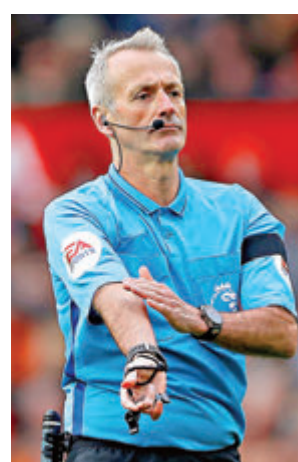
●球證在吹罰手球時，將要根據新規則作決定。

IFAB表示，為了給球員、教練以及球證更多時間消化和理解規則調整，他們將新規則的執行起始時間從6月1日推遲至7月1日。不過各賽事有權選擇提前開始執行新規則。 僅就英超而言，本賽季以來有關手球的判罰就不止一次出現爭議。4日富咸0：1不敵熱刺的比賽中，富咸曾有一記入球被判無效，當時熱刺球員解圍時將球踢到富咸球員自然下垂的手臂上，隨後另一名富咸球員射命中。依照新規則，這入球顯然可以保留。