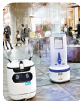
商場設置機械人噴消毒噴霧。