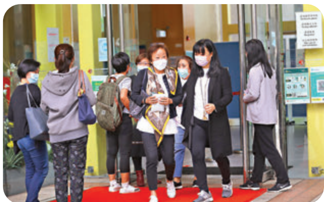
不少市民前往中山紀念公園體育館社區疫苗接種中心，接受疫苗注射。

一名55歲患有高血壓等長期病的女子，上周二(2日)接種科興疫苗3天後，出現急性缺血性中風，延至昨日凌晨不治。醫管局昨日透露，死者接種疫苗前後的30分鐘觀察期，均無向醫護提出有任何不適。新冠疫苗臨床事件評估專家委員會共同召集人孔繁毅表示，死者死於中風，外國無數據顯示疫苗會誘發中風，委員會將於明日(8日)開會討論事件。衛生署助理署長陳凌峯表示，科興疫苗在全球已注射4,400萬劑，無死亡個案證明與接種科興疫苗有關，故毋須叫停接種計劃。