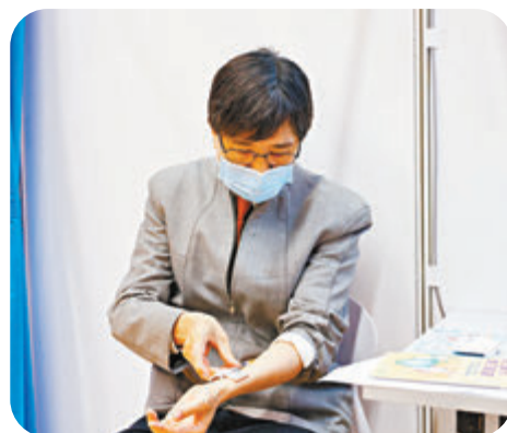
袁國勇自行注射「復必泰」疫苗。