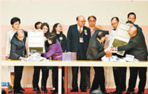
圖為2017年12月12日，第五屆特別行政區特首選舉點票場面。

由此可見，選委在香港政制循序漸進地發展的同時，因應香港實際情況不斷擴大，增加了不同界別的政治參與，令選委會更有廣泛代表性，是次選舉制度的完善亦是一脈相承。