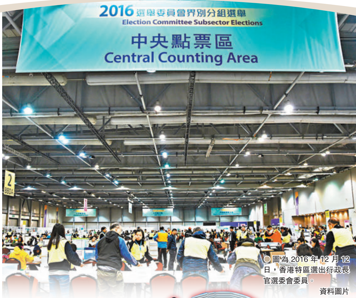
圖為2016年12月12日，香港特區選出行政長官選委會委員。