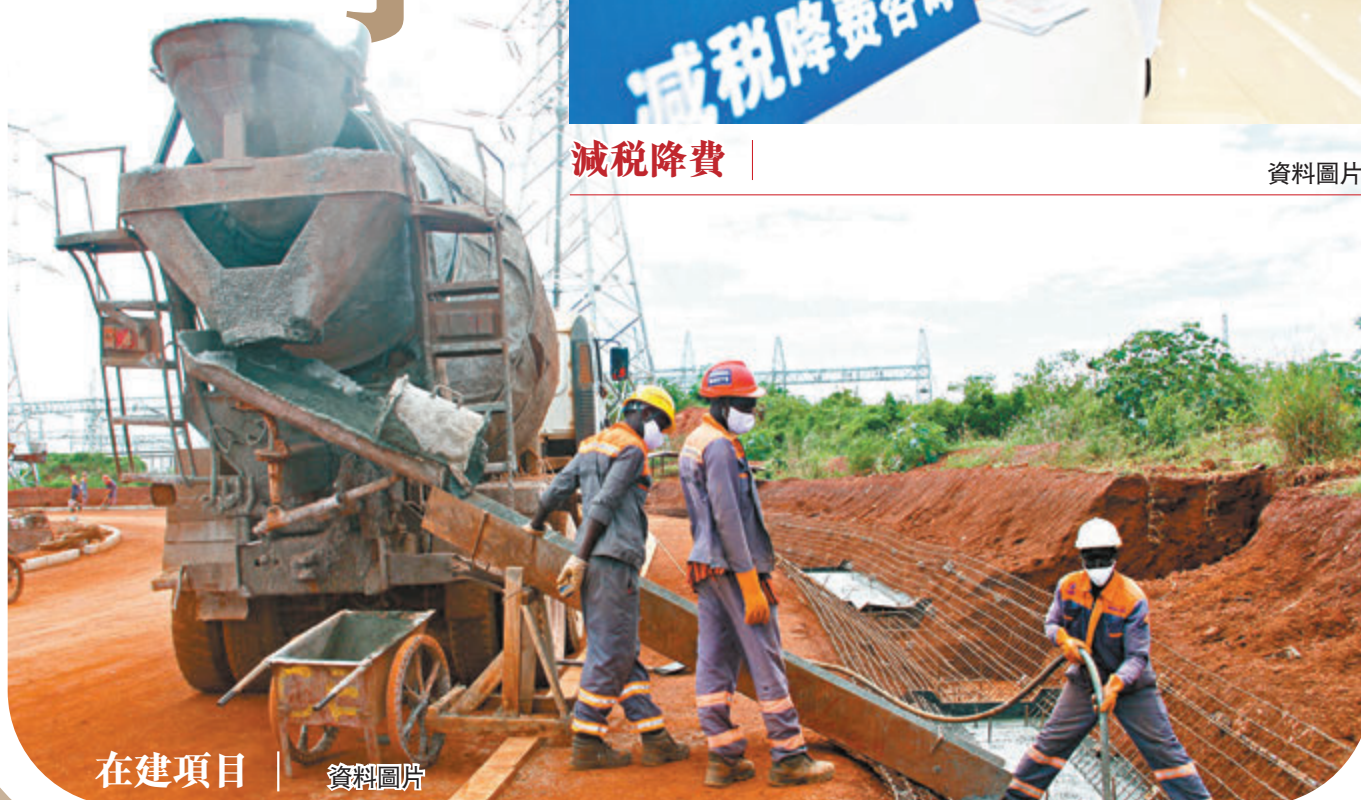
在建項目 資料圖片