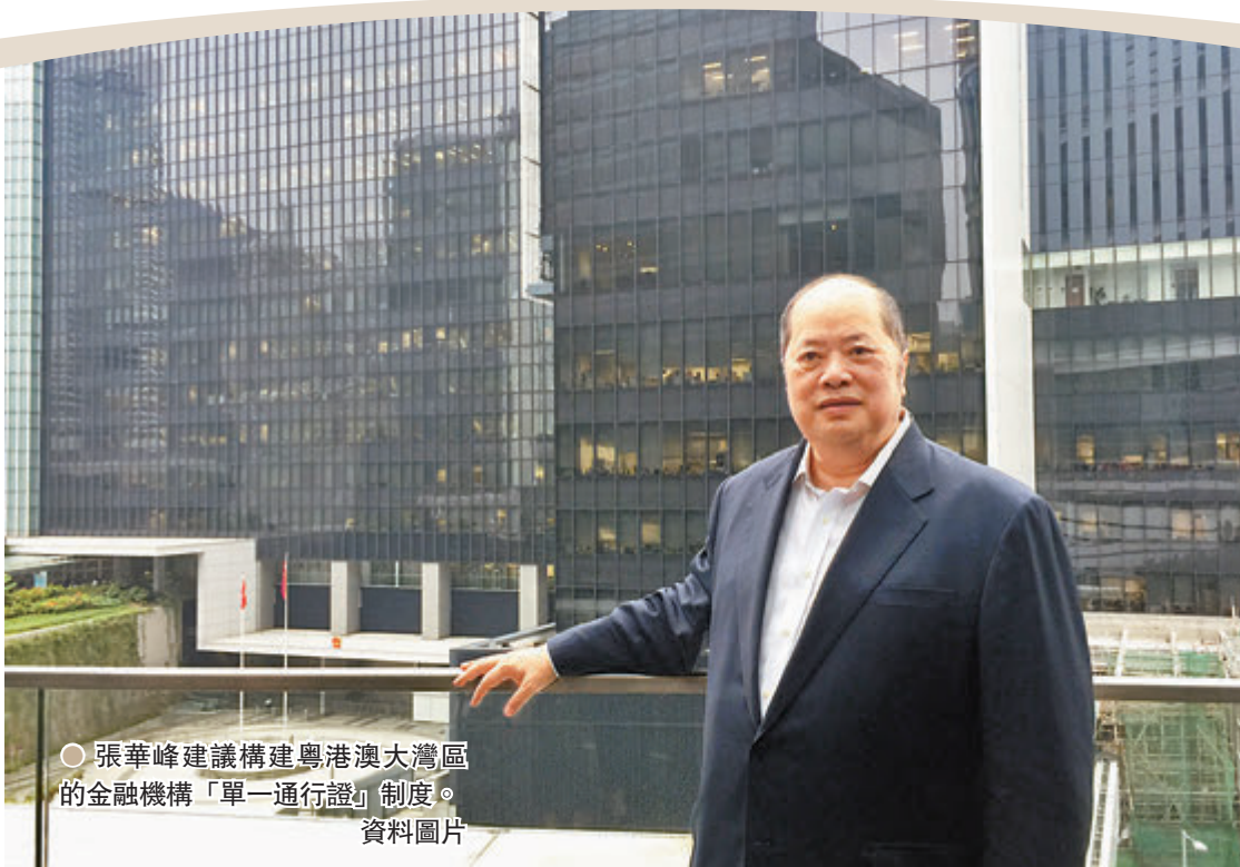
張華峰建議構建粵港澳大灣區的金融機構「單一通行證」制度。資料圖片

全國政協十三屆四次會議日前開幕，港區全國政協委員、香港立法會金融服務界議員張華峰提交了構建粵港澳大灣區金融「單一通行證」制度的提案，建議中央支持借鑒歐盟的經驗，構建粵港澳大灣區的金融機構「單一通行證」制度，既幫助香港業界開拓大灣區業務，又加快推進大灣區金融一體化，為國家加快形成「雙循環」新發展格局提供有力的金融支撐。 ● 香港文匯報記者 蔡競文