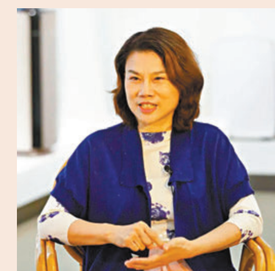
董明珠稱，建設起人才培養平台，是一個企業良性的發展循環。

董明珠認為，自主創新最後落腳點還是人的問題。「一個好的企業，是靠一代一代人承接下去的。格力電器剛開始做空調時沒有核心技術，如今格力創造了很多新技術。」她說，建設起人才培養平台是一個企業良性的發展循環，「雖然人才培養需要投入大量的資金、時間等，但企業要有長遠的發展眼光，敢於付出時間和金錢成本給年輕人機會去鍛煉。」對人才的吸引不僅僅要靠引進，還要做好長遠規劃，促進高校和企業的合作，加快人才培養。她透露，格力於2018年開始建設的3,000餘套人才公寓將於今年竣工完成，「屆時員工可拎包入住」。她指目前格力電器已解決1.2萬珠海員工住房問題，基本實現「一人一居室」，同時還從話費補貼、員工重大疾病救