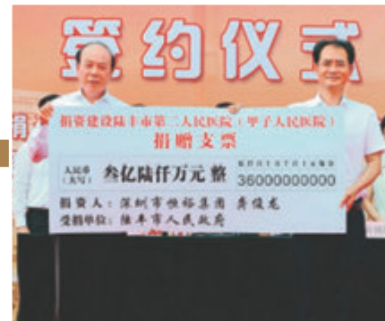
▲2018年恒裕集團捐資4.2億元建造陸豐市第二人民醫院