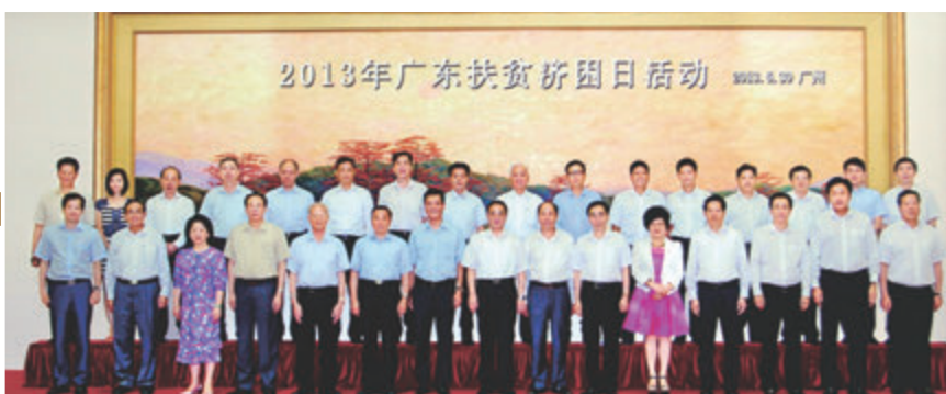
▲2013年廣東扶貧濟困日活動