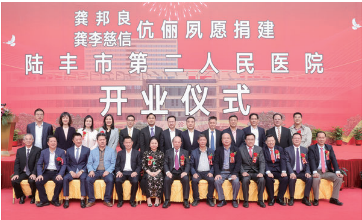
▲陸豐市第二人民醫院項目的落地，是恒裕集團幫助陸豐市解決「看病難、看病貴」問題的民心工程