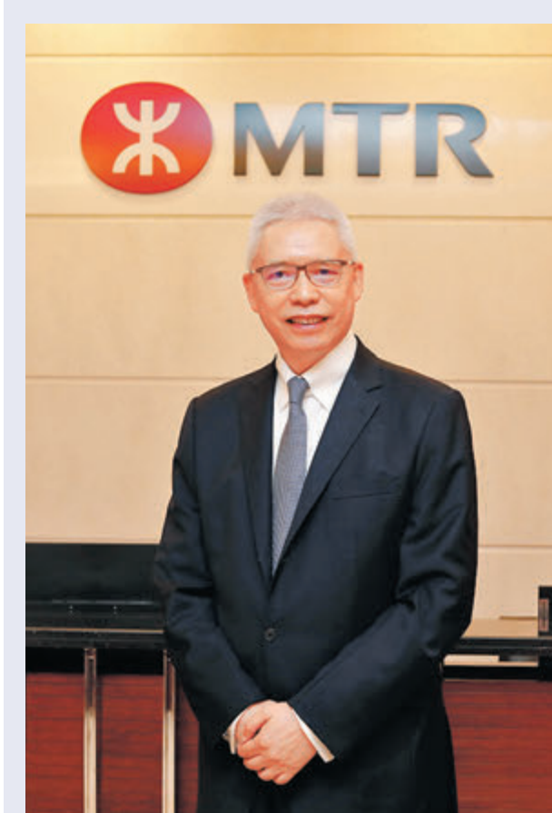
●港鐵公司主席歐陽伯權接受香港文匯報訪問。

完善鐵路網絡亦是港鐵未來的重要發展方向，歐陽伯權表示，港鐵已啟動東涌綫延綫、屯門南延綫、古洞站和北環綫的詳細規劃和設計工作，但他表明，港鐵定會汲取以往同期進行多項鐵路工程的教訓，事前做好規劃及工作分配，令工程能有序地進行。