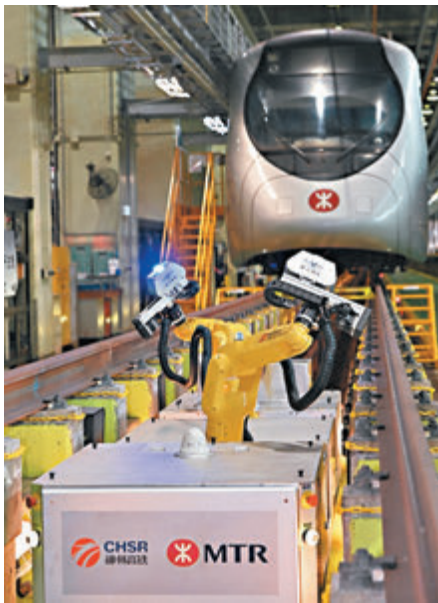
●車底智能檢測機械人。

他指出，港鐵會研究在鐵路設施裝設「安心出行」的可行性，但若措施將大幅延長乘客的出行時間就未必可行，需要審慎考慮。而現時港鐵已在所有商場及車站內相關場所張貼「安心出行」二維碼。