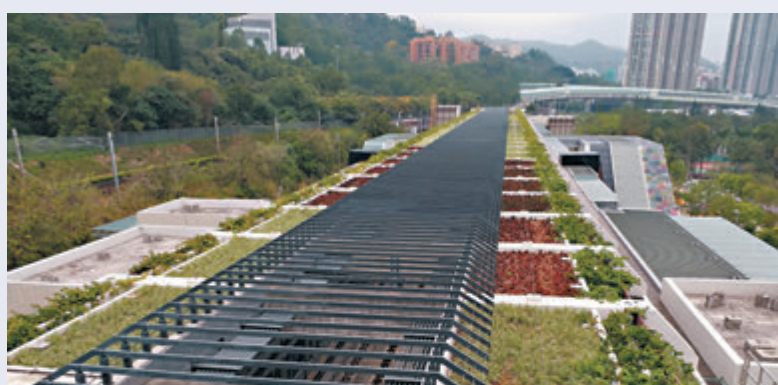
▲顯徑站設大型綠化天台及外牆安裝環保物料製成的遮光板，減少碳排放。