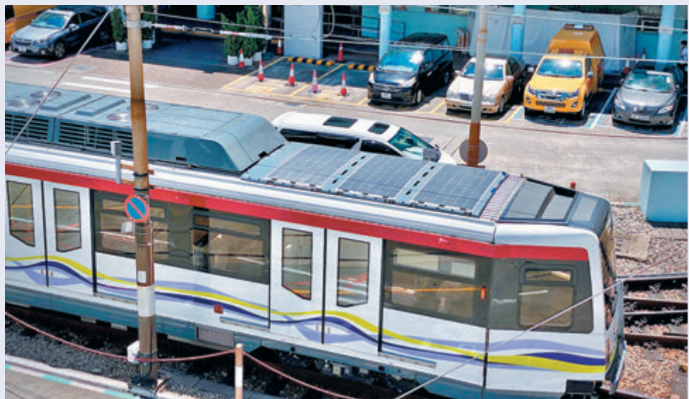
▲輕鐵車頂安裝太陽能發電板。