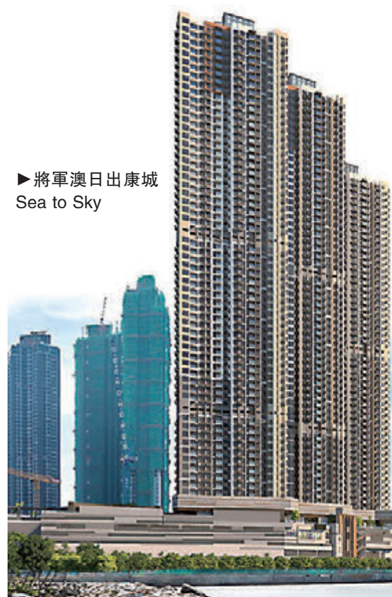
▶將軍澳日出康城 Sea to Sky

長江實業在香港的酒店及服務套房物業提供約15,000間客房。集團旗下海逸國際酒店集團為香港主要酒店品牌之一，管理分布於香港島、九龍及新界的11家酒店，合共8,500多間客房、套房和服務式套房，於業內地位舉足輕重。其中「港島海逸君綽酒店」及「九龍海逸君綽酒店」為集團旗艦酒店項目，多年來曾招待不少訪港政商人士及旅客。此外，全新「歷山酒店」即將正式投入業務，為集團的酒店及服務套房組合提供840間房間。