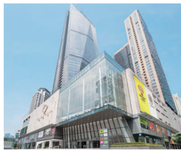
▲深圳世紀匯、世紀匯廣場及世紀匯·都會軒

「世紀匯」坐落於深圳地鐵一號綫華強路站上蓋，人流匯聚。商場樓高七層，總建築面積約59,000平方米，匯聚著名零售品牌及環球美食。「世紀匯廣場」為樓高四十八層的甲級寫字樓；而「世紀匯·都會軒」則是集商務與家居一體化的高級商務公寓，總建築面積約40,000平方米。整個項目為區內市民提供便捷的一站式生活體驗。