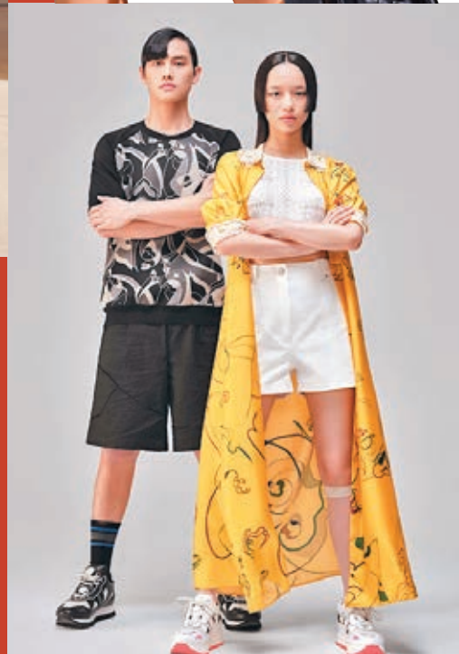
● SHIATZY CHEN 早春系列