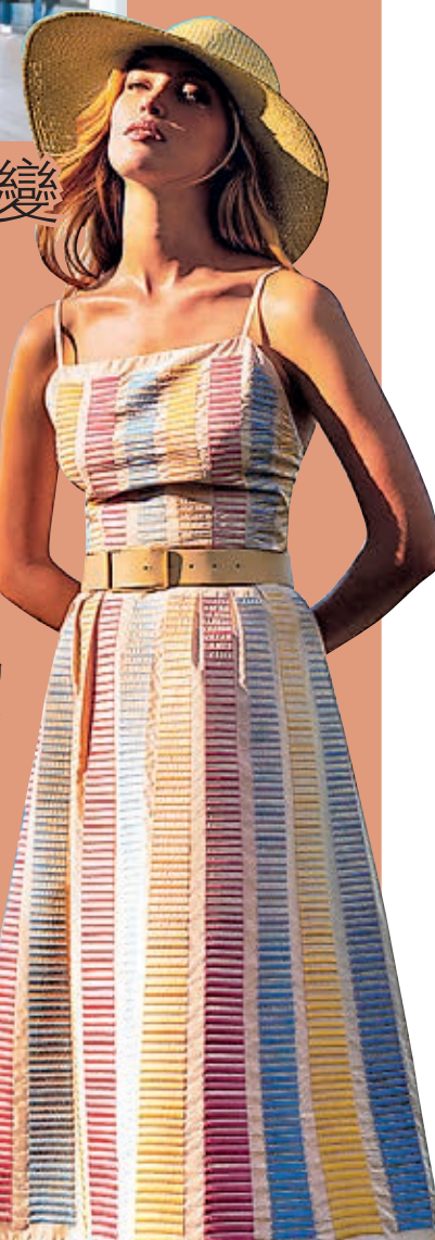
● Loro Piana 春夏系列早前發布

還有，以各種喀什米爾羊毛混紡而成的束腰外套、卡班大衣、斗篷和背心；喀什米爾套衫、上衣或 polo 衫搭配七分褲；洋裝和襯衫式洋裝展現自然優雅的氣息，衣服上或裝飾滿植物印花圖案，或點綴做工精細的珍貴迷人刺繡，配色以低調、含蓄的春日色彩為發想，從初春時節利尼亞諾的細膩色彩汲取靈感，讓所有感官沉浸在幸福喜悅之中。