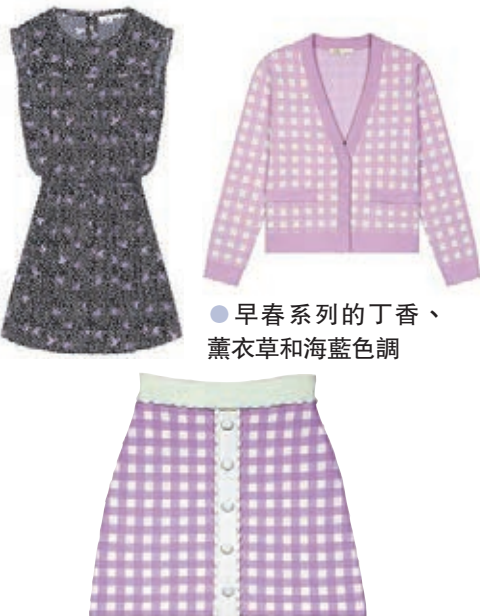
● 早春系列的丁香、薰衣草和海藍色調

品牌的早春系列運用不同的天然質料如棉質、雪紡和羊絨，全都具有親膚拉伸質感，精緻的花邊、水牛格紋和紫羅蘭印花突顯了巴黎的經典、隨性自然與時尚，刺繡和褶皺細節則表現出極致女性化的風格。而性感的綁腰襯衫、俏皮的娃娃裙、舒適的開胸外套和針織上衣配裙子套裝，則以富有現代感的剪裁賦予新鮮感。