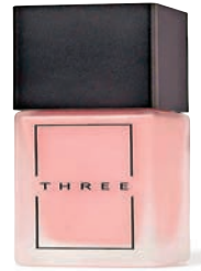
● 柔光極致晶透乳霜

THREE 全新柔光極致晶透乳霜，豐富的保濕度及零界線的延展，迎來柔滑平順的肌膚質感，猶如精華液般舒適的妝前乳霜，以含有植物恩惠的護膚品般的調配成分，調整肌膚乾燥或是肌理紊亂導致的膚色不均，為肌膚注入潤澤並調整至均勻狀態。與同步發售的粉凝霜均含有植物由來成分「Smooth Fiber 柔光纖維」，在肌膚表面形成極薄透的纖維密網，全新成分遮蓋肌膚暗沉，導向均勻膚色及明亮膚質，宛如清新花瓣暈染般，賦予淨透肌膚生命感、透明感、血色感。其修飾膚色不均，同時喚醒充滿自然紅潤氣色的活力肌膚。