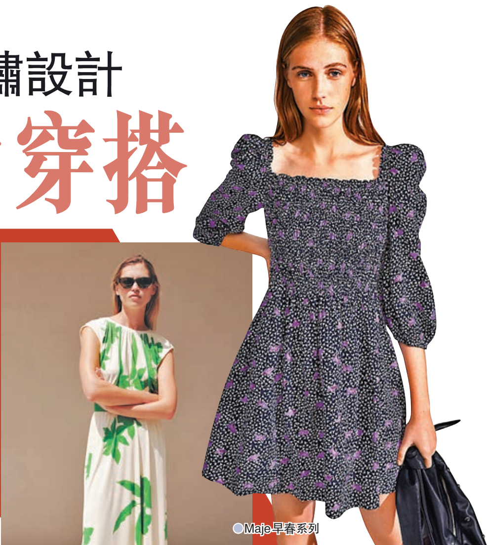
● Maje 早春系列