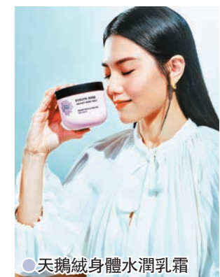
● 天鵝絨身體水潤乳霜

例如，Evelyn Rose 天鵝絨身體水潤乳霜，絲絨身體潤膚乳液豐盈如霜，絲滑如油，接觸肌膚後融化，按摩塗抹時，乳霜融化為油，潤滑極致。而 Evelyn Rose 緞光絲滑護手霜，含有豐富保濕成分，推開後撫平肌膚，為肌膚緊緊鎖住水分。由即日起至 3 月 29 日，品牌推出 Evelyn Rose 系列專屬優惠，包括 Evelyn Rose 全系列產品 9 折優惠，Evelyn Rose 精選皇牌套裝 85 折優惠，Evelyn Rose 全系列產品任選 3 件即可享 85 折，以及凡購物滿 HK$600 即可享 Evelyn Rose 旅行套裝乙套等。