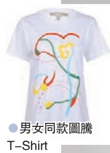
● 男女同款圖騰 T-Shirt

另外，早春系列的農曆新年獨家開版印花則延續早春如意圖騰，以繁複的線條表現其蜿蜒曲線，如同綿延子嗣的吉祥意象，相近的色系與凹凸的織紋使得布料肌理更為有趣，呈現出雅致且復古的風格。