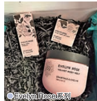
● Evelyn Rose 系列