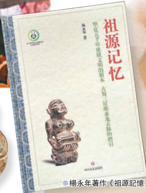
●楊永年著作《祖源記憶》