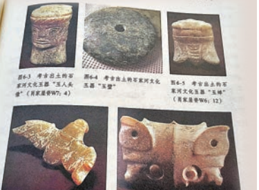
●《祖源記憶》書籍內頁