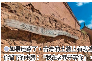
●如果迷路了，古老的主牆上有我為你留下的木牌：「我在老巷子等你」。

當你踏入這裏，時間彷彿就慢了下來……所謂「一步一景」，不要以為只會出現在柔媚清麗的江南園林之中，在這西北的彪悍之地，也能有這般柔情……逛老巷子，適合一個人來，尤其在秋天，下着小雨更好，靜靜穿梭在各條巷子，踩着青石鋪就的小路，任憑思緒萬千，那是一種使人心安的意境。