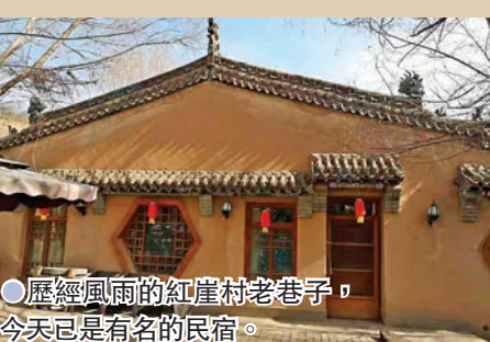
●歷經風雨的紅崖村老巷子，今天已是著名的民俗。

如今這些都已經遠去，消散在歷史的塵埃裏，只留下整個安靜的小村，秘密不再被人提起，更多的只是享受它的寧靜和安詳！第一次看到如此別致的小村子，真的沒想到在西北荒涼之地竟然隱藏着這樣韻味十足的古村落。