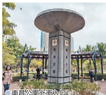
●南昌公園北面入口。