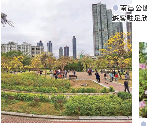
●南昌公園吸引遊客駐足欣賞。