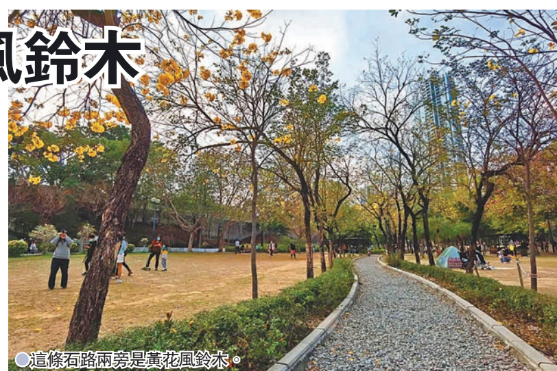
●這條石路兩旁是黃花風鈴木。