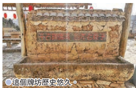
●這個牌坊歷史悠久。

整個巷子雖只有200餘米長，但內容極其豐富，有老戲台、老磨房、老水井等鄉村建築。來到這裏，你可以看到戲曲表演，走進家庭客棧，品嚐農家菜餚等。走進這條巷子，它會告訴每一位遊客這樣一句話「我在老巷子等你」，使你不由自主地想何時能再來。如今的紅崖村有着厚重的歷史文化，已被打成了紅色旅遊景區及歷史文化名村。這裏也是「浪固原」的打卡地。被譽為「寧夏最美的老巷子」。石台階、石槽、門洞、老樹、老戲台、老磨坊、枯井、土蜂窩、磚雕照壁……以及別具一格的建築風格，構成了一幅優美的鄉村畫卷。