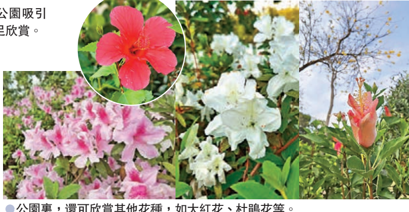
●公園裏，還可欣賞其他花種，如大紅花、杜鵑花等。