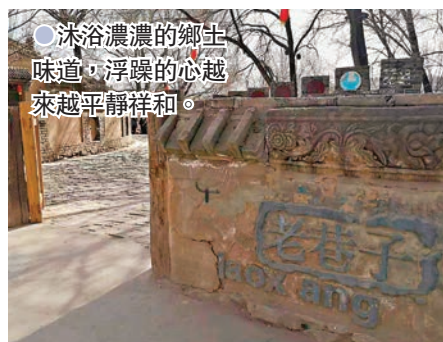
●沐浴濃濃的鄉土味道，浮躁的心越來越平靜祥和。