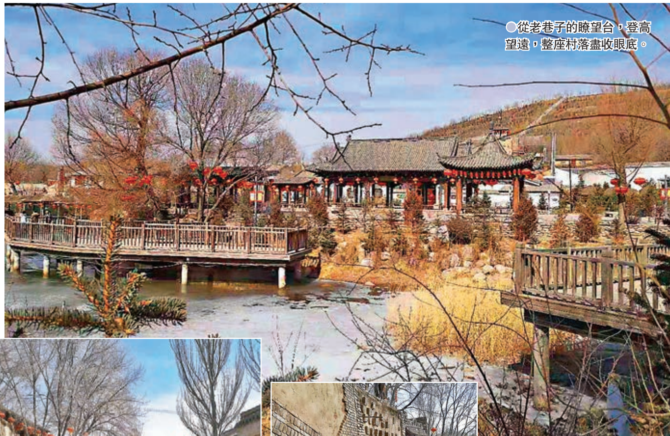
●從老巷子的瞭望台，登高望遠，整座村落盡收眼底。