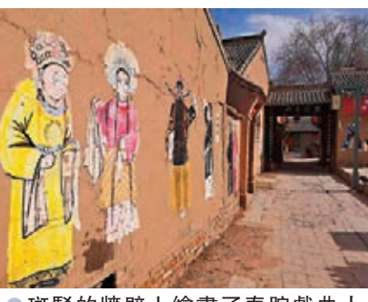
●斑駁的牆壁上繪畫了秦腔戲曲人物，既美觀又訴說了傳統文化。

來到固原境內的隆德縣老巷子，一下車，就被眼前的這個村寨城門式的門頭給吸引了。漫步在老巷子的土路裏，享受古樸風雅的靜謐，時光似乎有種倒流的錯覺。那種久違的感覺給人以安靜，這是一個讓人來了就不想走的地方。現在，可以自豪地說，成都有寬窄巷子，隆德有老巷子，沒有過多商業化的浸染，老巷子更有野趣韻味，讓人流連忘返。