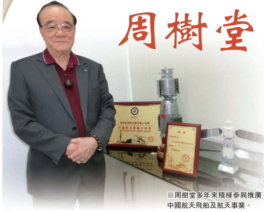
周樹堂多年來積極參與推廣中國航天飛船及航天事業。