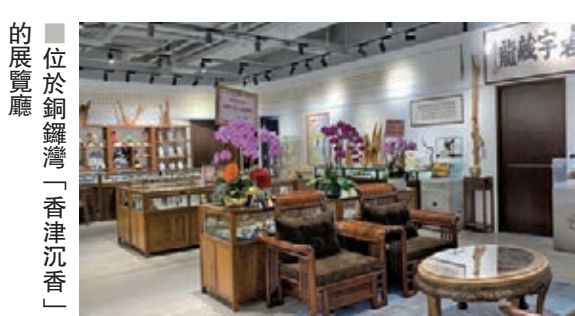
位於銅鑼灣「香津沉香」的展覽廳