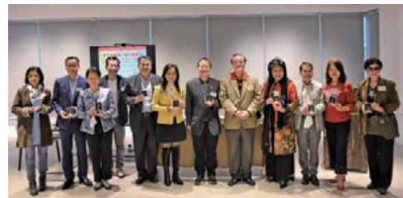
日前在福榮堂展覽廳舉行的「助力航天大聯盟」抽獎活動，嘉賓合照留念。