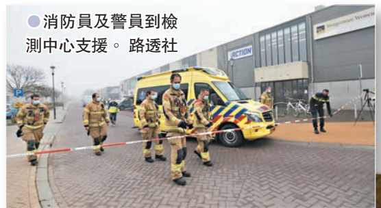
●消防員及警員到檢測中心支援。

事發於昨日早上，檢測中心位於北荷蘭省博芬卡斯珀爾鎮，中心在開門時間前突然傳出爆炸聲，隨即多扇玻璃窗破碎。警方在現場發現一個金屬容器，相信是用作放置爆炸品，目前未知兇徒身份和犯案動機。