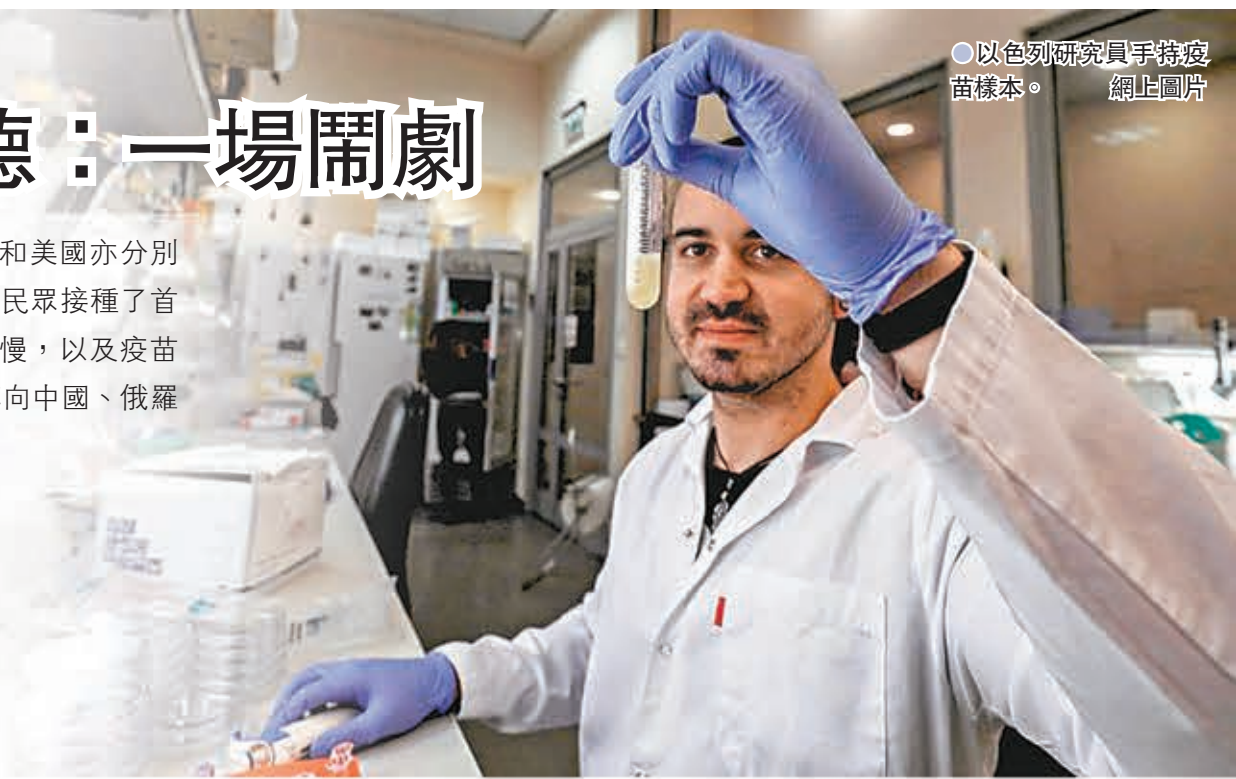
●以色列研究員手持疫苗樣本。

全球各地展開新冠疫苗接種計劃以來，以色列的接種率達92%，英國和美國亦分別有31%和22%國民已打針，相反擁有近4.5億人口的歐盟，至今僅5.5%民眾接種了首劑疫苗，訂購疫苗太遲、監管機構歐洲藥品管理局(EMA)審批速度太慢，以及疫苗供應不足，是接種進度落後的主因，部分歐盟成員國已按捺不住，紛紛轉向中國、俄羅斯和以色列尋求協助，反映歐盟的統一疫苗接種戰略已名存實亡。