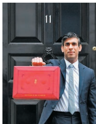
●辛偉誠發表新一份財政預算案。路透社

辛偉誠指出，由於疫苗接種進度理想，英國經濟有望在明年中恢復疫情前水平，較之前預測提早約6個月，預計今年經濟增長率為4%，低於去年11月預測的5.5%，但明年則預計增長7.3%，較之前預測高0.7個百分點。 ●路透社