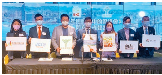
●香港菁英會及香港青年聯會昨日公布一項「青年團體眼中的區議會」問卷調查。

香港菁英會及香港青年聯會於去年12月31日至今年1月14日期間，以網上問卷形式進行了「青年團體眼中的區議會」問卷調查，成功收到2,045份有效問卷，以深入了解香港經歷了社會運動和疫情重創後，市民對第六屆區議會表現的評價及期望。 調查結果顯示，區議會過去一年的表現未能得到市民認同，超過六成受訪者表示不滿意區議會和區議員的表現以及他們在社區發展的工作，更有84.8%的受訪者認為區議會未能發揮作用及完成應承擔的工作，主要原因有區議會過度政治化、社區信息傳播及溝通機制失效、議員能力和經驗問題等。91.1%的受訪者期望區議員今後能夠「親身接觸居民及聽取居民意見和問題，作出積極回饋」，而期望區議員「與政府保持有效溝通」亦佔77%。 調查亦顯示，89.7%的受訪者同意區議員應宣誓遵守基本法，而91.3%的受訪者認同需要改革區議會以滿足市民期待，其中80.2%的人提議應「設立監察區議員表現的制度」。不少受訪者建議設立機制要求議員