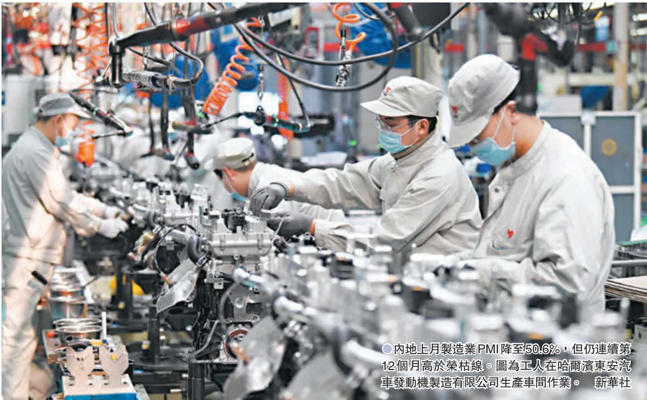
●內地上月製造業PMI降至50.6%，但仍連續第12個月高於榮枯線。圖為工人在哈爾濱東安汽車發動機製造有限公司生產車間作業。

國家統計局服務業調查中心高級統計師趙慶河分析說，今年春節假日落在2月中旬，假日因素對企業生產經營影響較大，製造業市場活躍度有所下降，景氣水平較上月回落。 此前支撐經濟快速復甦的進出口景氣度下降，2月新出口訂單指數時隔五月重新降至榮枯線下。趙慶河說，受春節期間企業生產、採購活動放緩等影響，製造業外貿業務較1月有所減少。