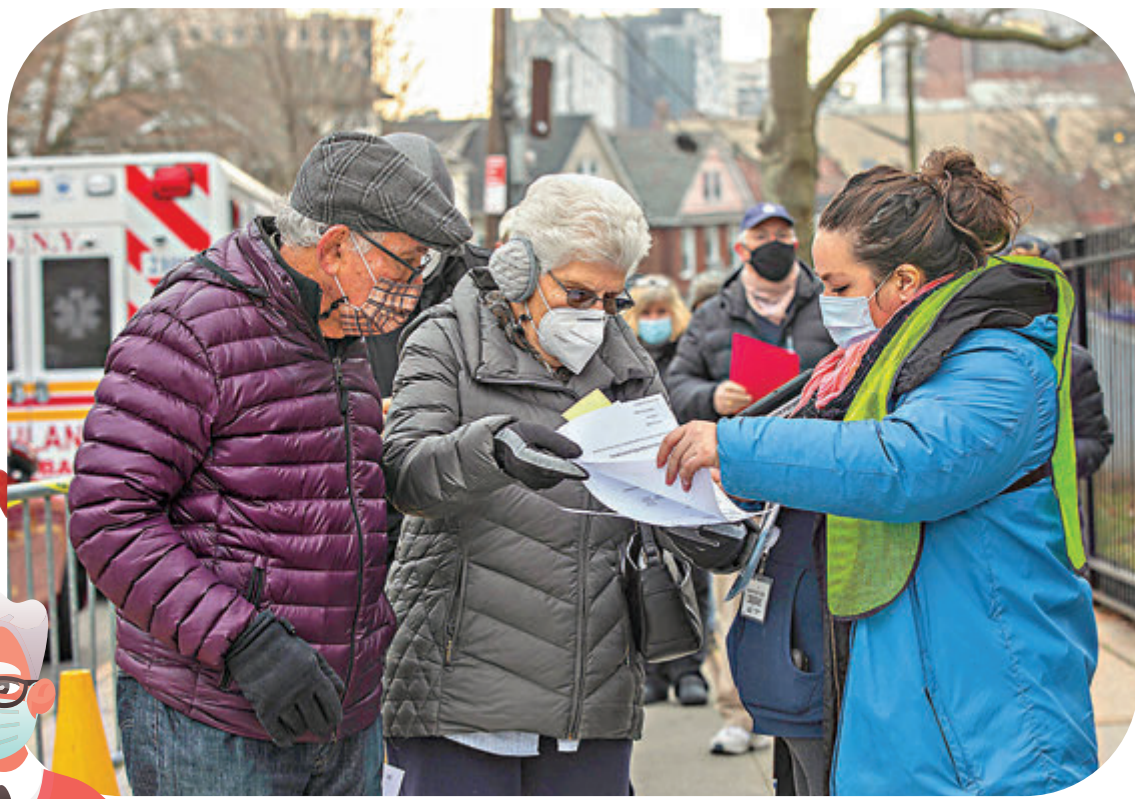
●美國預約打針系統複雜，不少長者都感到困難。

本港上周啟動新冠疫苗接種計劃，不過市民需要提前網上預約，對部分長者而言可能不太方便。類似情況在美國都出現過，為了方便和鼓勵長者接種，當地志願團體積極與政府部門合作，提供協助長者預約服務，包括設立打針熱線讓長者致電預約，或者代長者預約打針等，官民齊心一致加快整體接種速度。