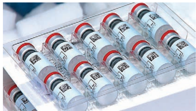
● 強生疫苗料獲審批採用。