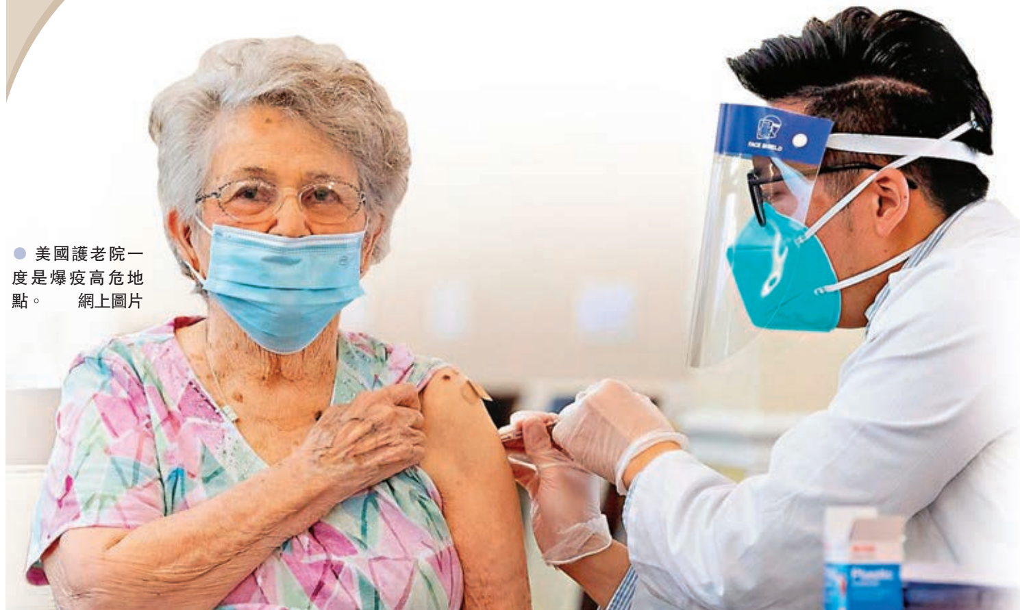
● 美國護理院一度是爆疫高危地點。網上圖片

長者一向屬新冠肺炎的高風險感染群組，在美國受疫情重創期間，護理院更是爆疫高危地點，相關死亡個案佔整體1/3以上。美國去年12月啟動新冠疫苗接種計劃後，護理院院友和員工列為優先接種組別，隨着許多長者已打針，近日最新數據顯示，美國護理院的確診個案在兩個月內大幅下降超過80%，相關死亡個案亦急跌至至少65%，較全國整體跌幅多近一倍。有專家認為數據令人鼓舞，顯示疫苗對長者有效，對其他群體而言亦是一個好消息。