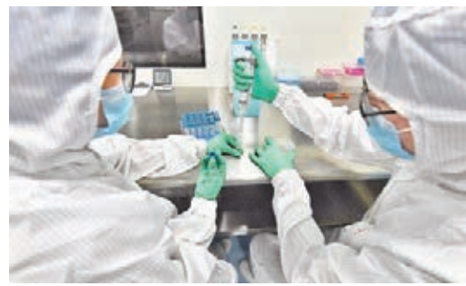
●成都博奧晶芯生物科技員工在生產呼吸道病毒核酸檢測試劑盒。資料圖片

面對這場正改變人類社會生態的重大疫情，進一步向科研「無人區」進發，是中國科技界的必要選擇。