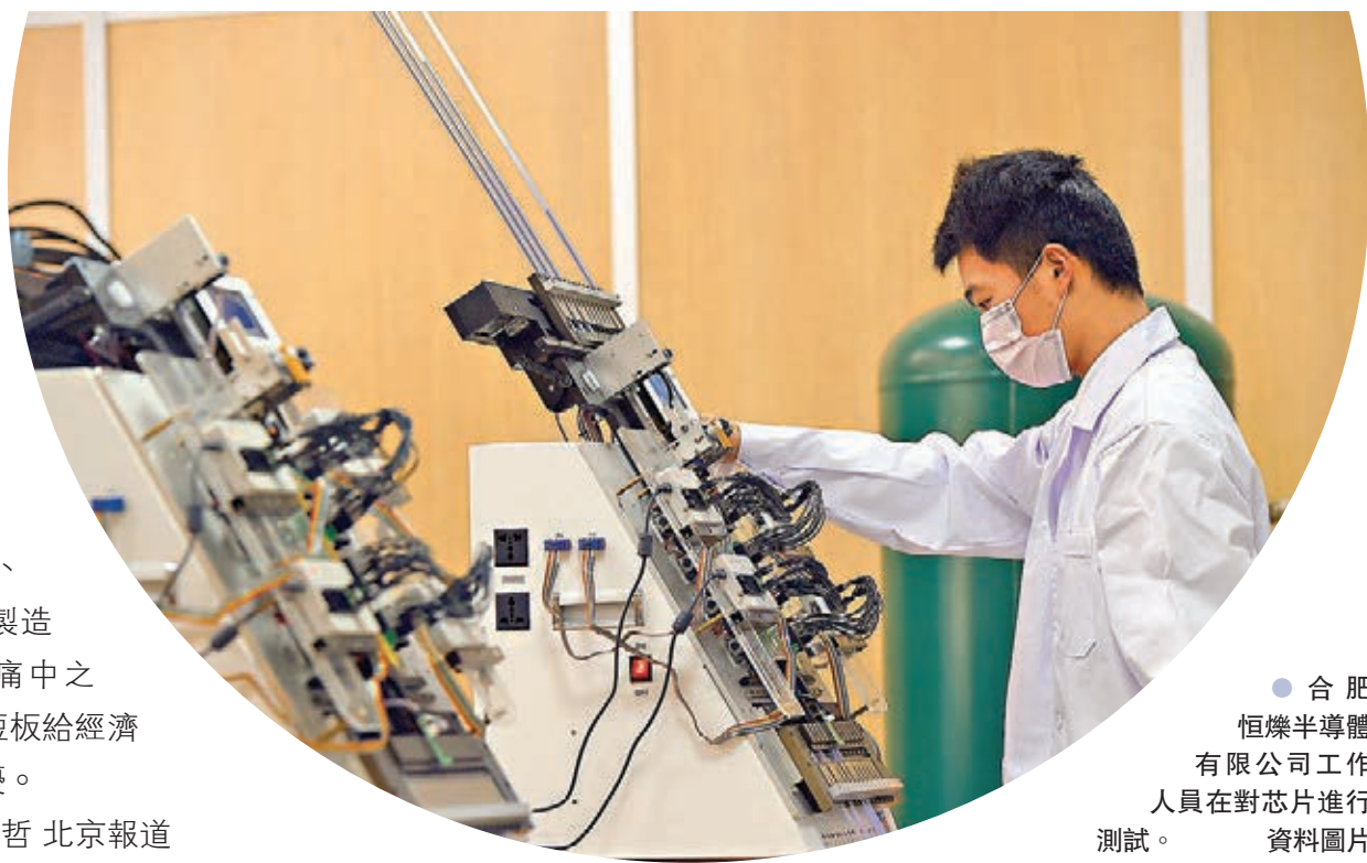
●合肥恒燦半導體有限公司工作人員在對芯片進行測試。資料圖片