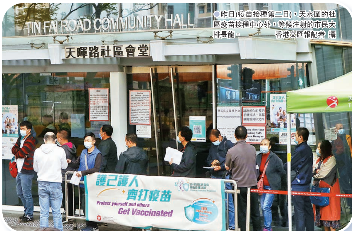
●昨日(疫苗接種第三日)，天水圍的社區疫苗接種中心外，等候注射的市民大排長龍。

發言人又表示，私家醫生在獲發的第一批疫苗將近用完時可按需求再次預訂，該署會根據醫生用量及疫苗供應情況，統籌發送及監察整體疫苗使用的情況。