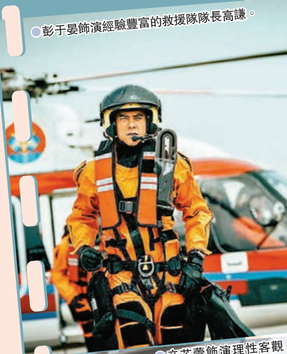
●彭于晏飾演經驗豐富的救援隊長高謙。

而除了精彩的動作設計，導演林超賢希望用更有戲劇張力的情節和人物關係，讓觀眾了解更多關於救援隊員工作的信息。基於此，林超賢在電影《緊急救援》中設計了救援隊長高謙和直升機機長方宇凌兩個性格迥異的角色。「高謙救援經驗豐富，比較感性，會救助盡量多的被救人員；但機長的職責要求方宇凌理性客觀，她要從數據出發保證任務執行的成功率。」飾方宇凌的辛芷蕾相信，雖然人物性格不同，但兩個角色在工作中都有各自的亮點，也有共同的出發點和目標，觀眾會在他們的故事中感受到救援隊員們的人性光輝。