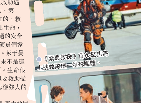
●《緊急救援》首次聚焦海上救援隊這三特殊團體。