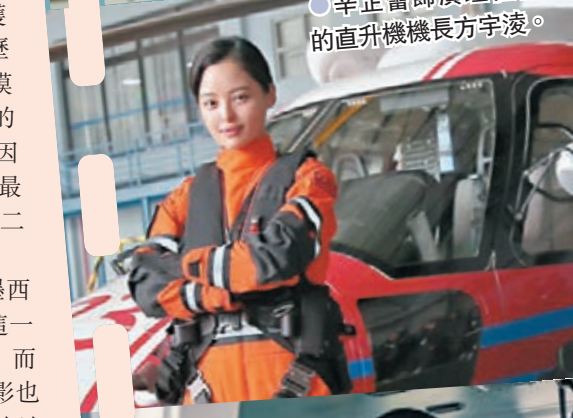
●辛芷蕾飾演理性客觀的直升機機長方宇凌。