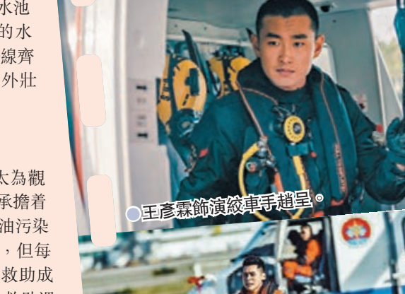
●王彥霖飾演絞車手趙呈。