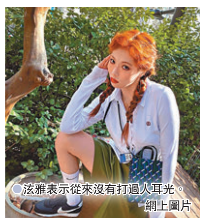
●泫雅表示從來沒有打過人耳光。

而韓國組合(G)I-DLE成員徐穗珍近日也被指是校園暴力的加害者，經常對同學、童星出身的演員徐信愛有侮辱性發言，說「你爸爸沒媽的嗎？」等，還找理由和其他同學吵架等，徐穗珍對此否認，表示沒有對徐信愛施暴過，稱兩人在學生時代沒有聊過天。