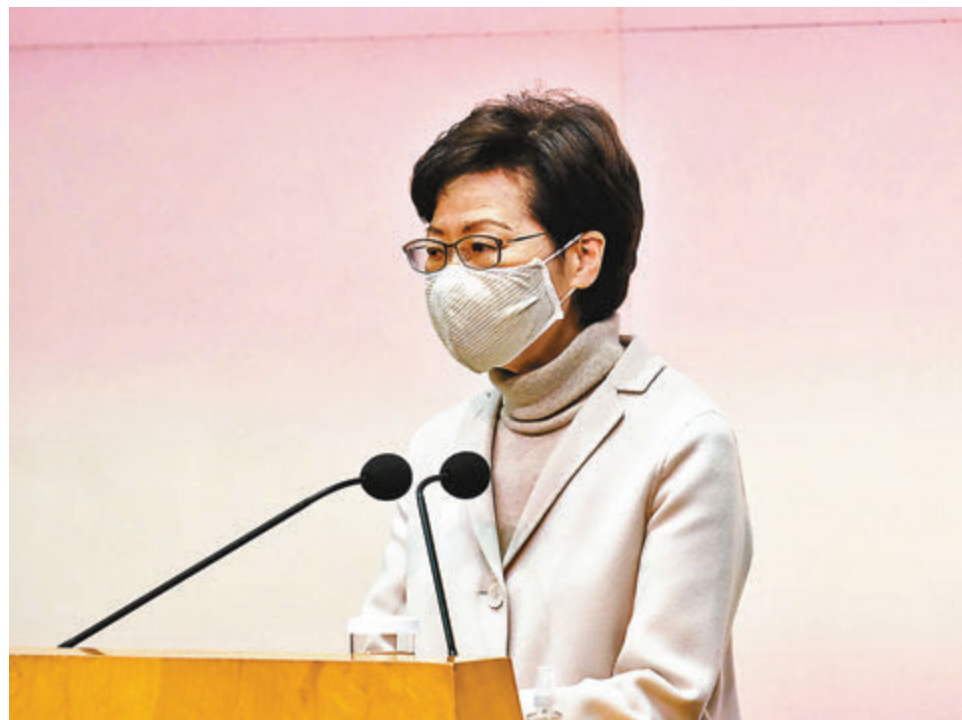
●林鄭月娥出席行會前的記者會。

要有勇氣和決心撥亂反正、正本清源。被問及如何確保法官愛國，林鄭月娥回答說，香港是依法辦事的社會，特區政府是依法施政的政府，這亦得到中央的全力肯定和認可。她說，最重要的法律當然是憲法，香港是中華人民共和國不可分離的一部分，所以中華人民共和國的憲法對於在香港怎樣落實「一國兩制」是至為重要。另外就是基本法，而基本法有關於司法機構的詳細規定，確保香港的司法機構有獨立司法權，包括終審權，而司法機構法官的委任亦有清晰的規定。她表示：「我看不到在基本法中這麼重