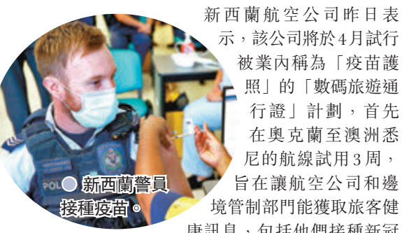
●新西蘭警員接種疫苗。

新西蘭航空公司昨日表示，該公司將於4月試行被業內稱為「疫苗護照」的「數碼旅遊通行證」計劃，首先在奧克蘭至澳洲悉尼的航線試用3周，旨在讓航空公司和邊境管制部門能獲取旅客健康訊息，包括他們接種新冠疫苗的情況。