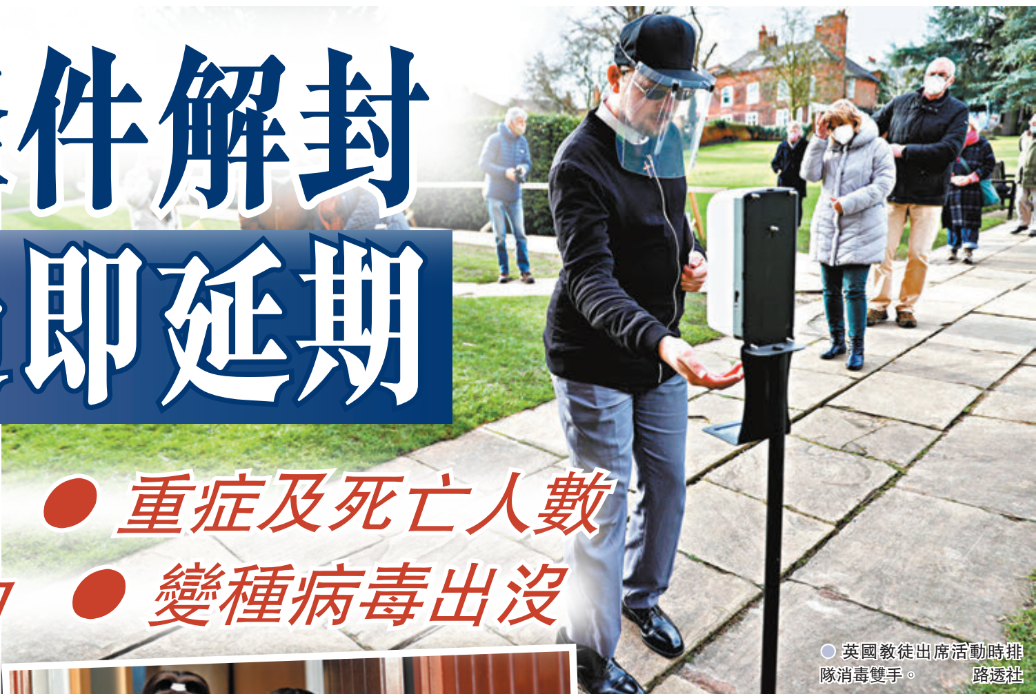
英國教徒出席活動時排隊消毒雙手。