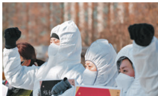
●韓國醫生威脅罷工。