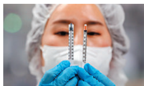
●新冠病人或只需接種一劑疫苗。