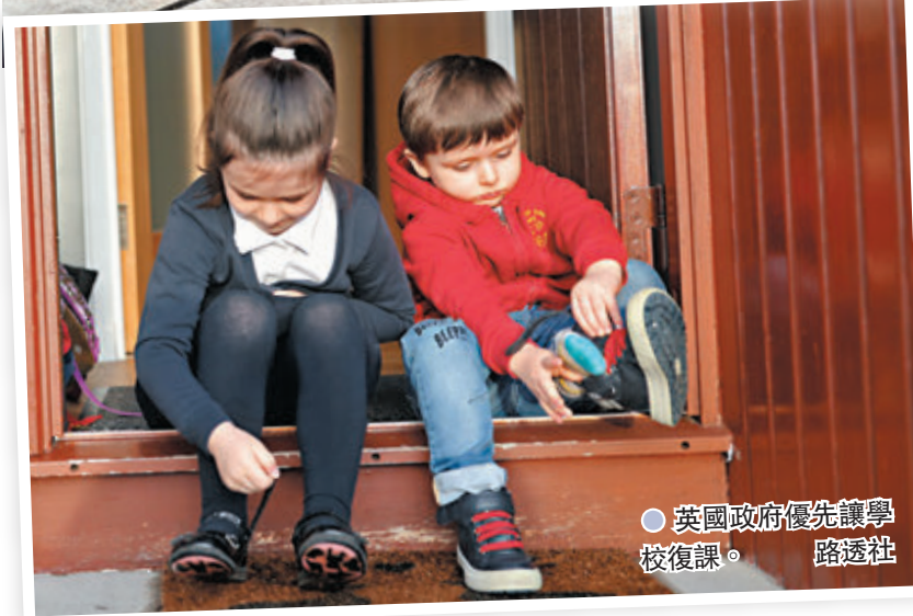
英國政府優先讓學校復課。

英國至今已有超過1/3成年人口接種新冠疫苗，當地疫情持續好轉，社會上要求解除封城措施的呼聲日增。首相約翰遜昨日正式公布英格蘭解封四階段路線圖，第一步是從3月8日起讓學校全面復課，此後將逐步放寬措施，目標是在7月底前解除大部分防疫限制。不過汲取了去年太早解封的教訓，約翰遜今次就為每階段解封定下「四大條件」，假如任何一項條件未能過關，當局便會推遲解封步伐。