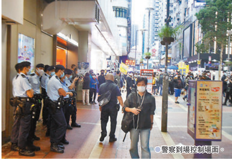
●警察到場控制場面。