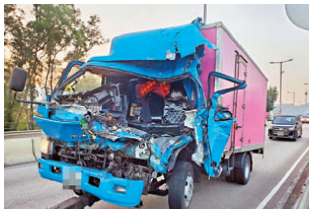
●肇事密斗貨車車頭嚴重毀爛。

會道失控，車頭猛撞向前面一輛重型貨車車尾鋼板，左邊車頭凹陷嚴重變形，擋風玻璃飛脫，車上兩名男女當場浴血被困，其中女乘客被救出送院搶救返魂乏術不治，男司機則受輕傷，但事後涉嫌危險駕駛導致他人死亡被捕。警方現正循車速、駕駛態度及機件等多方面追查意外原因。