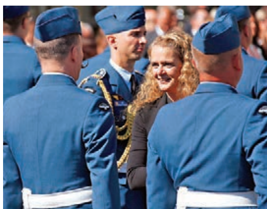
●佩耶特因被指控欺壓工作人員而辭職。資料圖片

其實加拿大人亦愈來愈厭倦英國王室擔當的角色。今年2月，超過一半受訪者認為英國王室不