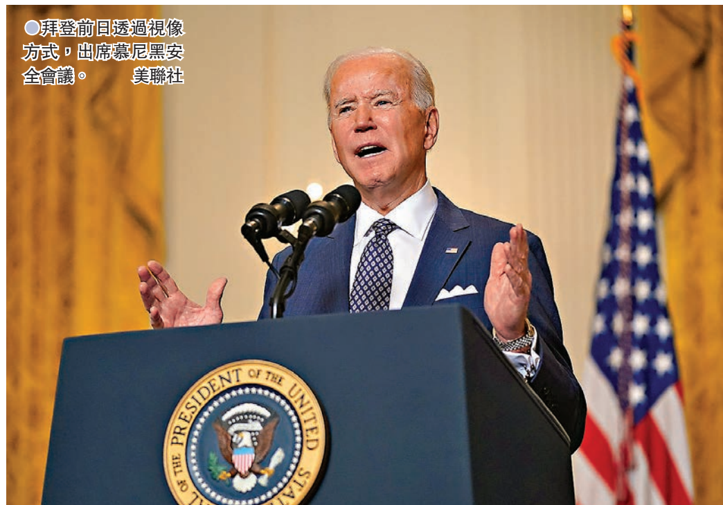
●拜登前日透過視像方式，出席慕尼黑安全會議。