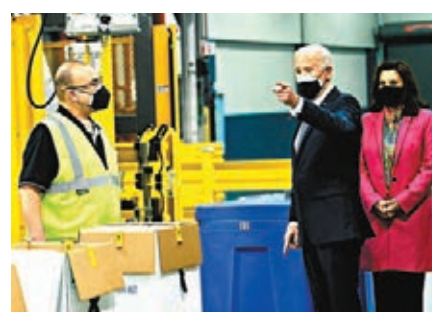
●拜登視察輝瑞藥廠。

美國總統拜登前日前往輝瑞藥廠生產新冠疫苗的廠房視察，期間發表講話，鼓勵民眾接種新冠疫苗，有信心民眾到今年底可恢復正常生活。輝瑞同日宣布與華府達成協議，未來數周的疫苗供應量將增加一倍。由目前每周平均500萬