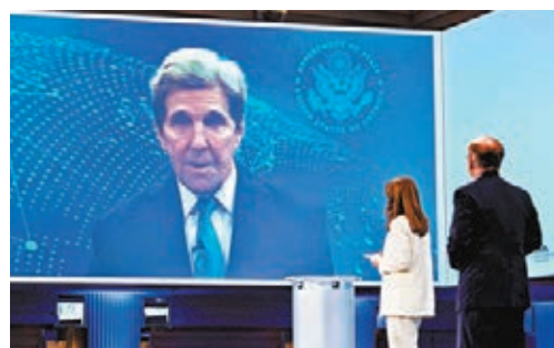
●克里在慕尼黑安全會議上視頻發言。

美國總統拜登上月就任首日便簽署行政命令，宣布重返應對氣候變化的《巴黎協定》，經過30天後，美國前日正式重回協定，多國外交官和科學家均表示歡迎。美國氣候變化問題特使克里稱，華府計劃與中國商討氣候政策。