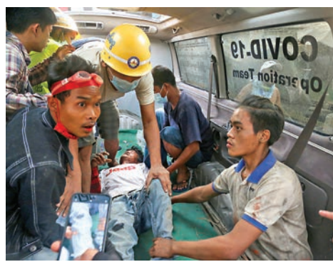
●一名示威者受傷被抬上救護車。