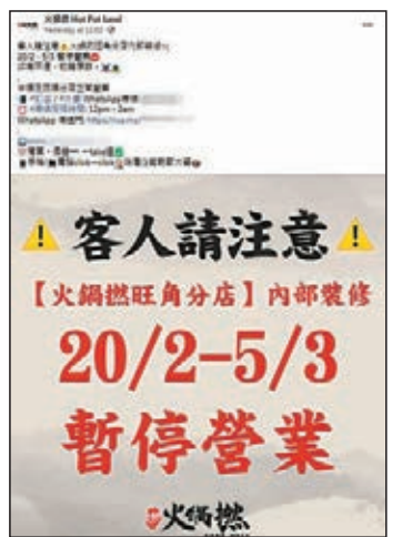
●「火鍋熱」被吊銷牌照停業14天, 仍夾硬稱「裝修」停業。 fb 截圖