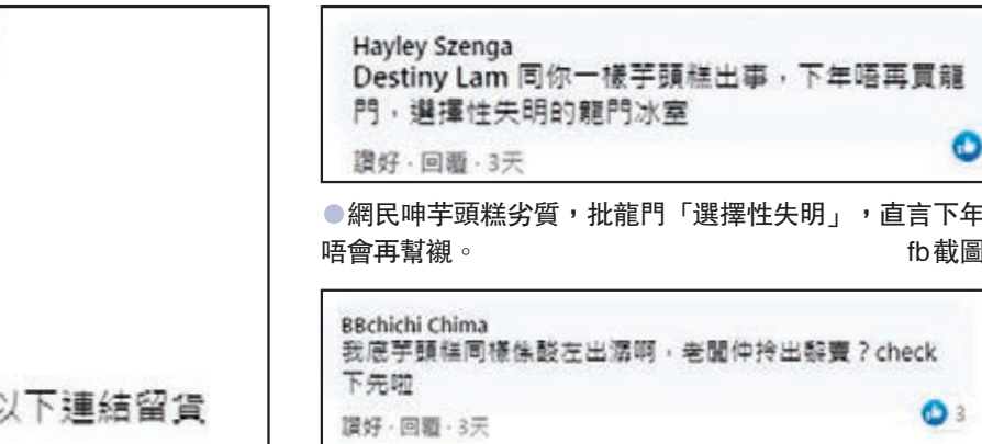
●網民指其購入的芋頭糕又酸又濕, 批龍門賣劣質貨。