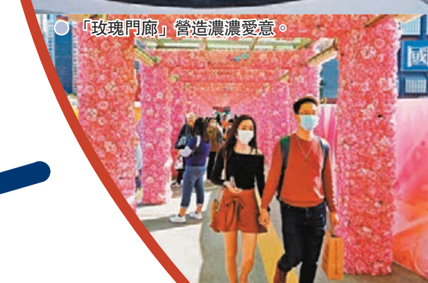
● 「玫瑰門廊」營造濃濃愛意。