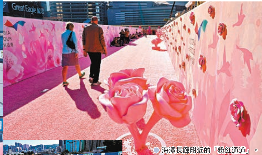
● 海濱長廊附近的「粉紅通道」。