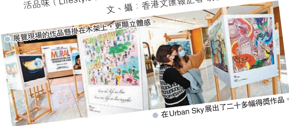
● 展覽現場的作品懸掛在木架上，更顯立體感。