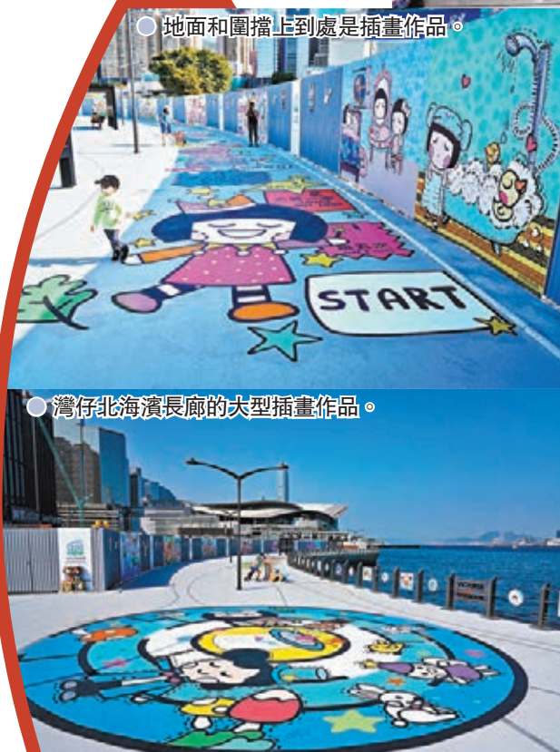
● 灣仔北海濱長廊的大型插畫作品。