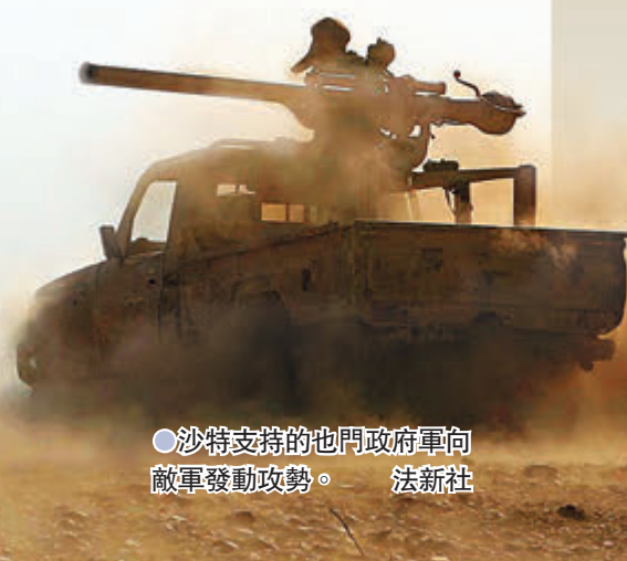
●沙特支持的也門政府軍向敵軍發動攻勢。