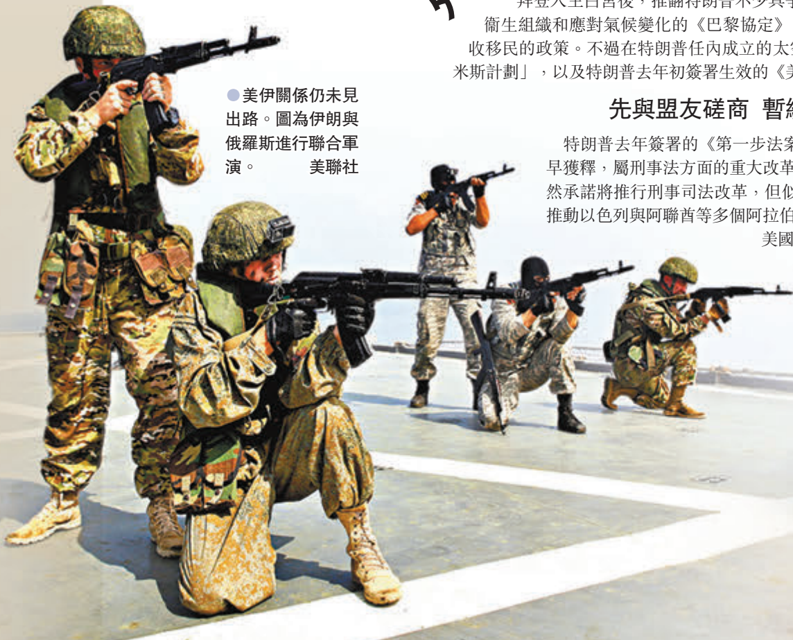
●美伊關係仍未見出路。圖為伊朗與俄羅斯進行聯合軍演。