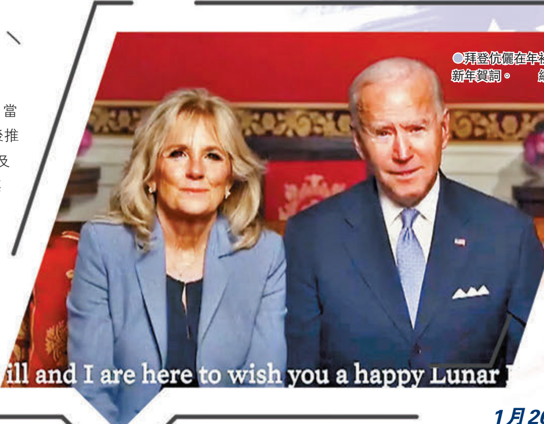
●拜登伉儷在年初一發布新年賀詞。

外交篇 天起，拜登就先後推翻多項前朝外交政策，包括重返《巴黎協定》及世界衛生組織、延長美俄裁軍條約，在中美關係方面，拜登一方面延續了特朗普時期的強硬路線，將中國稱為美國「最為嚴峻的競爭對手」，但另一方面亦多番表示與中國合作的意願。整體而言，拜登就職首個月的對華政策相對審慎，間中釋放出積極訊號，但長遠對中美關係走向有何影響仍有待觀察。