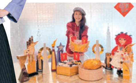
●莫文蔚期望牛年會有更好的成績。

香港文匯報訊（記者 李慶全）莫文蔚去年憑一首電視劇主題曲《呼吸有害》橫掃香港樂壇頒獎禮，全取4台大台最高榮譽大獎，可喜可賀。踏入牛年，莫文蔚選擇在大年初四好日子迎福運開工大吉，她更拿出之前所得的各大獎座，與全盒及金元寶放在一起，並與家人齊齊開心合照，將旺氣帶到新的一年。莫文蔚於社交平台留言：「牛『莫』王和莫家寶貝恭祝各位工作順利，牛年更牛、牛年大吉、牛年如意！」