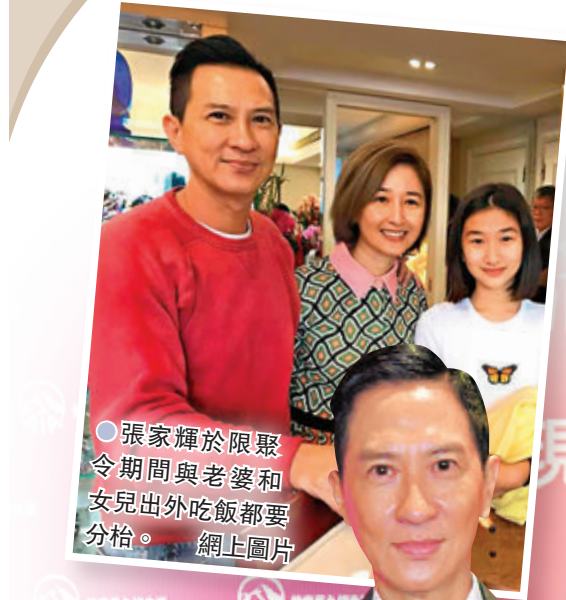
●張家輝於限聚令期間與老婆和女兒出外吃飯都要分格。