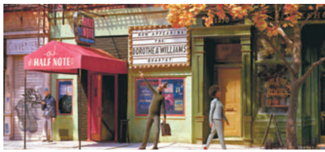
●《靈魂奇遇記》為奧斯卡「最佳動畫」大熱。

另外，《靈魂奇遇記》將於明日上映。金像導演彼德達維希望透過這個有趣故事帶出「生活中一些看來毫不重要的小確幸，才是生命意義所在」的正面訊息，對身處逆境的大家，會更覺窩心感動、更有共鳴。