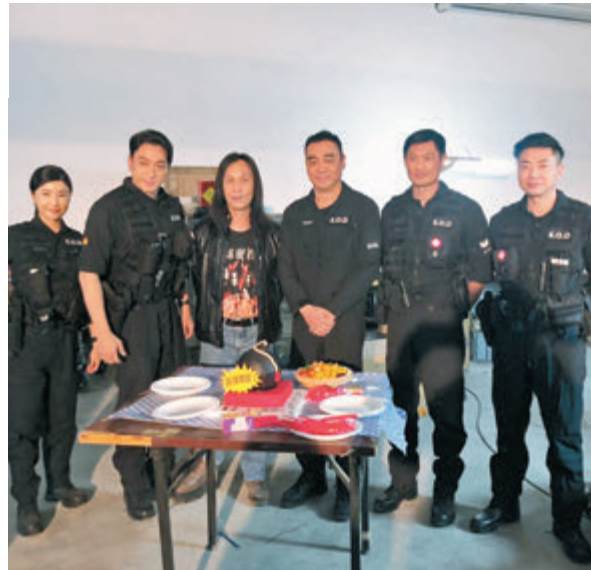
●劉青雲生日收炸彈蛋糕超驚喜。

香港文匯報訊（記者 李思穎）劉青雲、劉德華演出的電影《拆彈專家2》即將登場。青雲昨日踏入57歲生日，在早前參與《拆彈專家2》拍攝期間，亦適逢其生日，一眾「拆彈隊員」與導演邱禮濤及幕後工作人員齊齊送驚喜，為青雲在片場慶祝牛一，而劇組人員更專誠訂做一個別具心思的炸彈型蛋糕，逗得青雲笑不攏嘴。