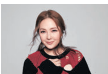
●衛蘭希望將盡可能多的愛和光傳播到這個世界上。

衛蘭很期待參與這項有意義活動，她謂：「我覺得這是我人生的使命，將盡可能多的愛和光傳播到這個世界上，透過我的音樂和我做的事去幫助和治療社會上有需要的人。尤其是在這個艱難的時刻，我們確實需要起來與我們的社區接觸！願我們的善舉和行動能成為連鎖反應，也讓大家仿效。」