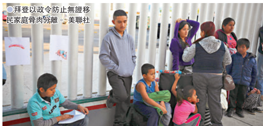
● 拜登以政令防止無證移民家庭骨肉分離。