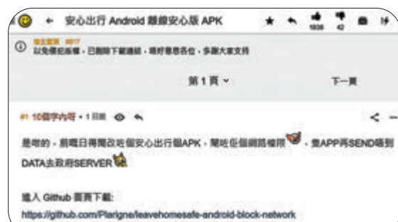
●有人在「連登」發帖教網民下載改版程式，但有關內容已被刪除。

翻查資料，「連登」討論區前日出現網民製作的「改版」程式，聲稱可供網民下載使用，令「安心出行」無法再傳數據到政府伺服器云云。有網民隨即附和稱：「有個 fake App（假應用程式）用，但又唔唔到資料，我地（咁）又唔唔擔心私隱（問題）。」不過，發帖者昨晚聲稱「以免侵犯版權，已刪除下載連結」。