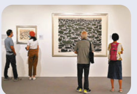
創作、表演及藝術 4,500人