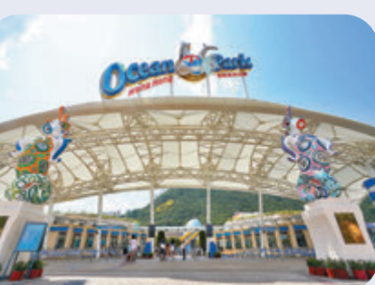
主題公園及遊樂園 7,100人